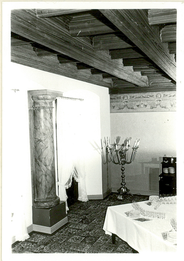
← strop i kolumna międzyokienna oraz polichromia w pomieszczeniu frontowym I p.