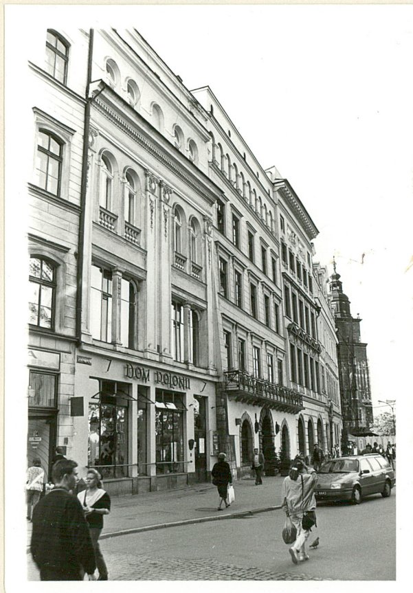
fasady budynków frontowych restauracji "Wierzynek"