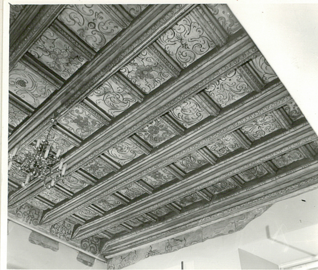
stropy pomieszczeń frontowych I p.