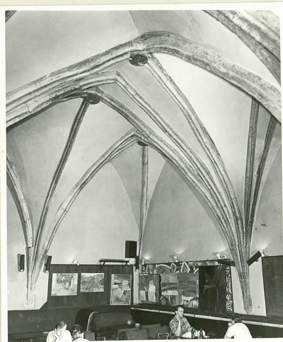
d. izba tylna

Okna II i III p. fasady usunąć, zastępując je stolarką wzorowaną na oknach I p. Poddać konserwacji zabytkowe wyposażenie klatki schodowej.