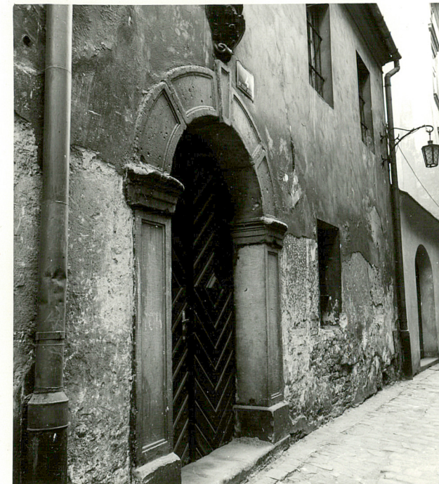
portal wejścia do sieni w elewacji pd.; w głębi elewacja pd. oficyny bocznej