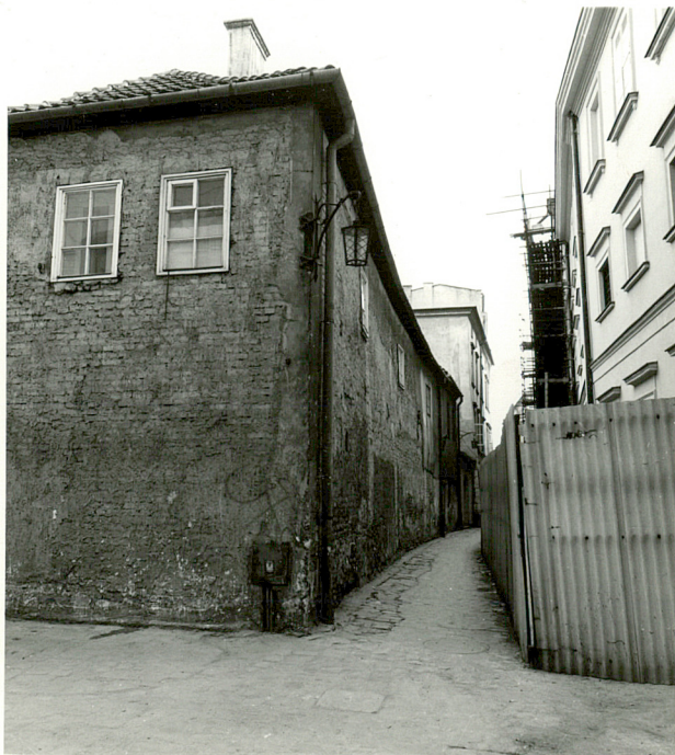
widok elewacji pd. i zach. od strony załamania ul. Senackiej

Instalacje: elektryczna, wodno-kanalizacyjna, gazowa.