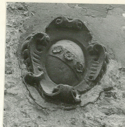
kartusz z h. Doliwa na elewacji pd.