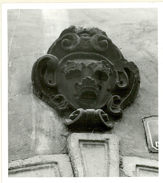
kartusz z h. kapituły krakowskiej nad portalem wejścia do sieni w elewacji pd.