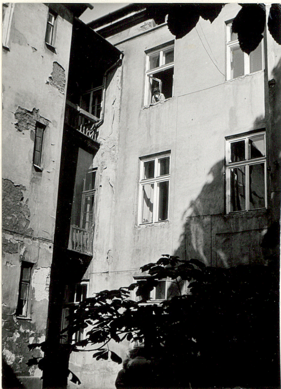
Elewacja tylna oś zachodnia