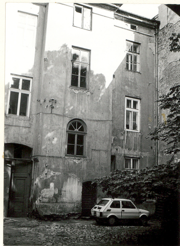
Elewacja tylna część wschodnia