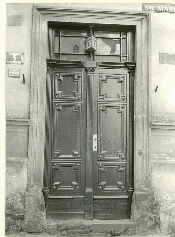
Detal - drzwi do sieni