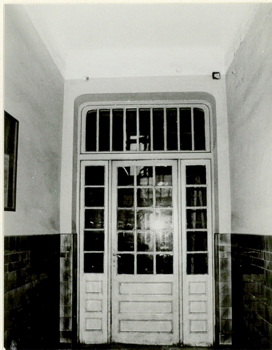
ścianka działowa w przejściu z sieni do klatki schodowej, widok od pd.