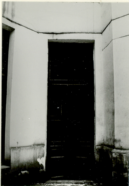
drzwi w wejściu do pomoc- niczej klatki schodowej w elewacji tylnej