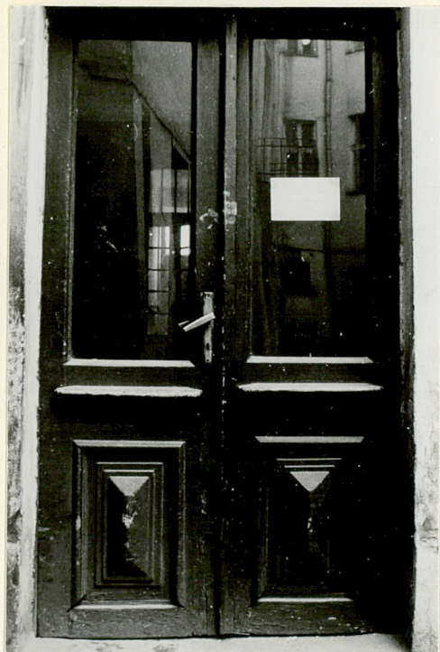
drzwi w wejściu do sieni w elewacji tylnej