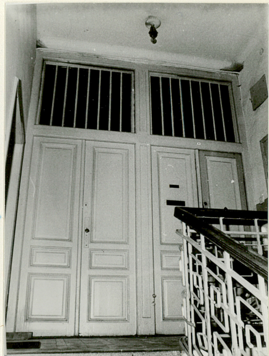
ścianka działowa oddziela- jąca klatkę schodową od po- mieszczeń II p.