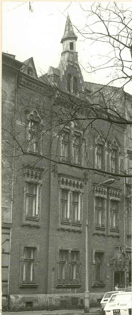
data wykonania miejsce przechowywania negatywów