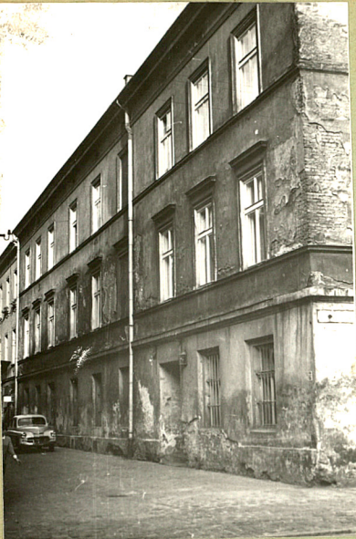
Stan 1966 4

Literatura: J. Lepiarczyk, H. Łocińska, J. Kwiecień Przebieg prac konserwatorskich Kielce 1953 str. 55