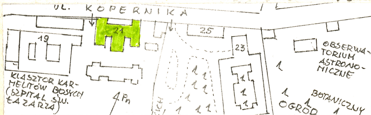
B. Plan sytuacyjny 1:2.500

Elektryczna, wodno - kanalizacyjna, centralnego ogrzewania, gazowa, telefoniczna.