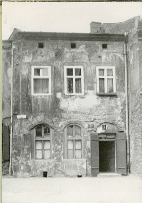
31. Szkic sytuacyjny, plan schematyczny, u