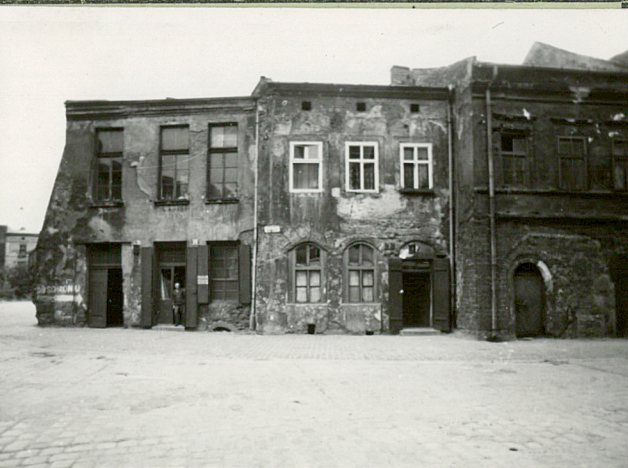
35. Uwagi różne