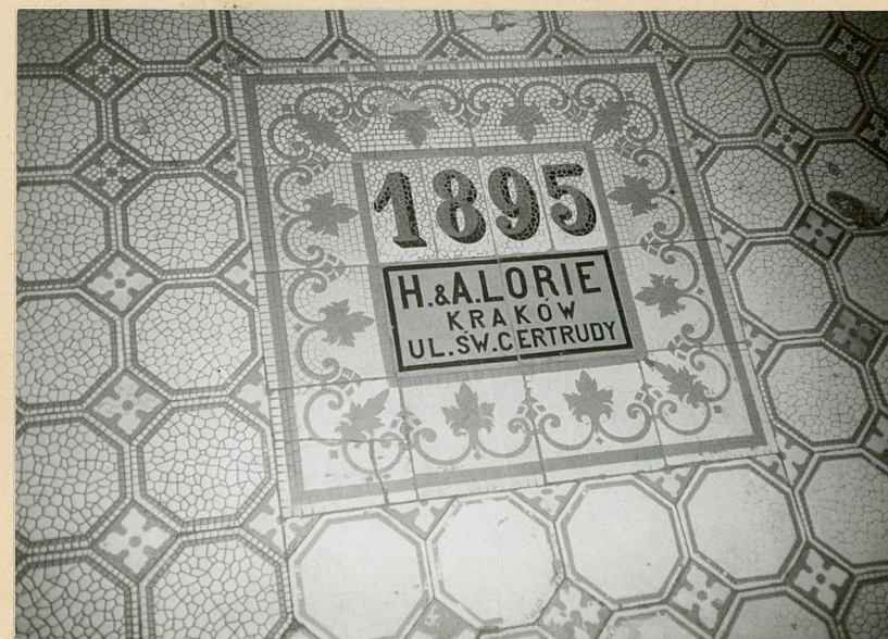
posadzka w sieni (hallu)

Wnętrza i wyposażenia: Brama wejściowa dwuskrzydłowa, płycinowa z przeszkleniami i nadświetlem o ozdobnych kratkach.Wystró hallu:schody kamienne,kolumny tokańskie, tralkowa balustrada,pseudokasetony sufitu,posadzki ceramiczne o dekoracyjnym wzorze.Wystrój klatek schodowych:metalowa balustrada z motywem wolut,fasety sufitu ostatniej kondygnacji,witraże w nad- świetlach drzwi do klatek schodowych ( z motywami róż i irysów),kolorowe przeszklenia okien,na podestach posadzki cera- miczne.W korytarzach posadzki dwubarwne.Pozostały wystrój:fragmenty architektoniczne okładziny przy drzwiach,stolarka płycinowa ze szpaletami,do auli z trójkątnymi przyczółkami,w korytarzach z przeszkleniami,stolarka okienna sześciopółowa Instalacje: elektryczna, wod.-kan., gazowa, c.o., telef.