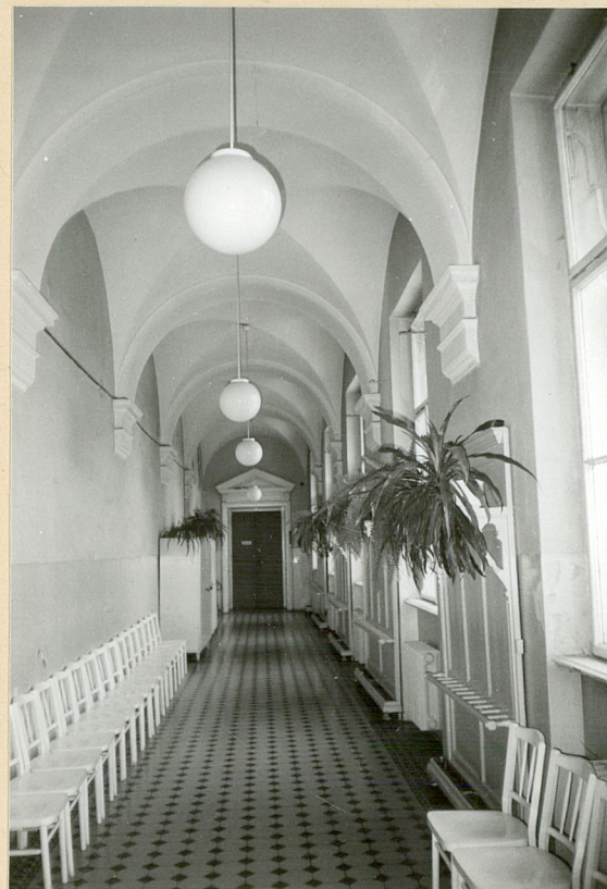
korytarz I piętra