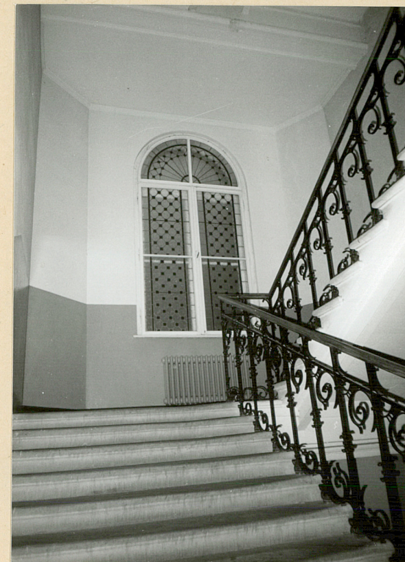
fragment klatki schodowej