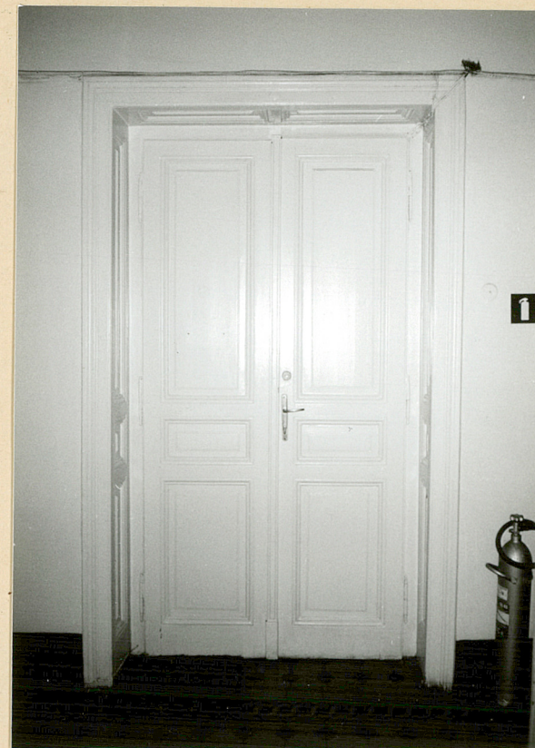
stolarka drzwiowa na I kondygnacji