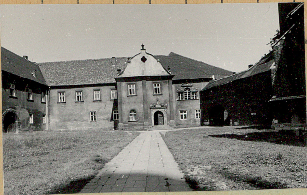
gi opisowe, fotografia