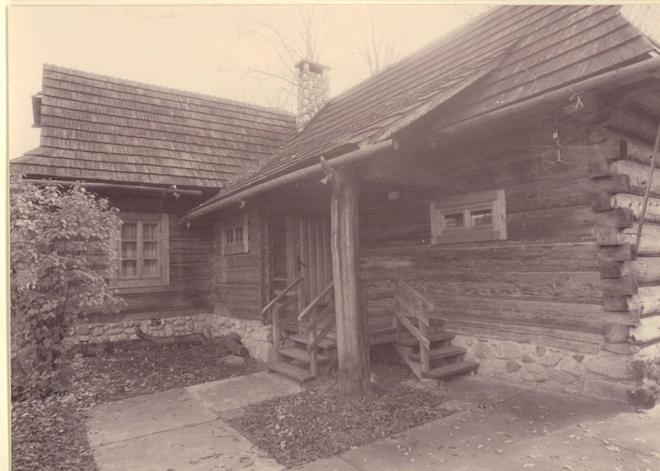
DZ 1978 r.