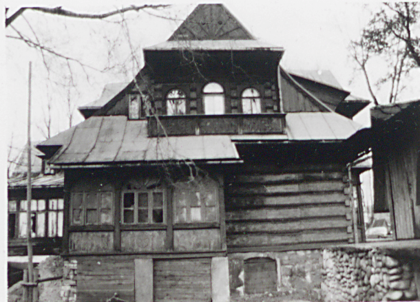
widok od zachodu