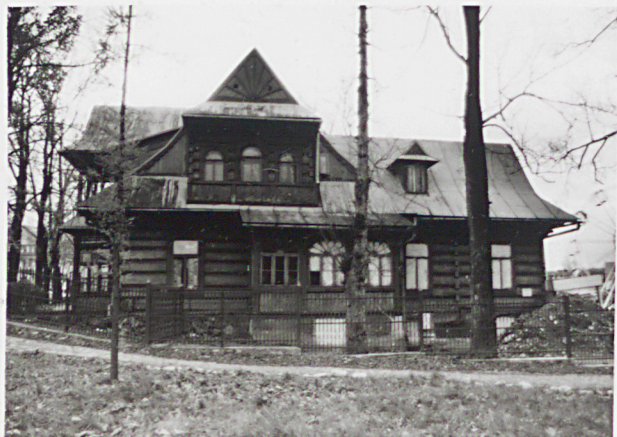
widok od wschodu