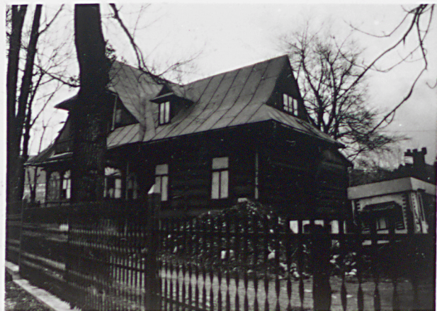
widok od płn-wsch.