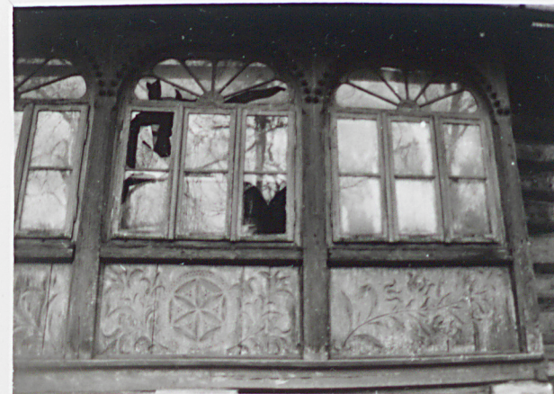
detal snycerski werandy