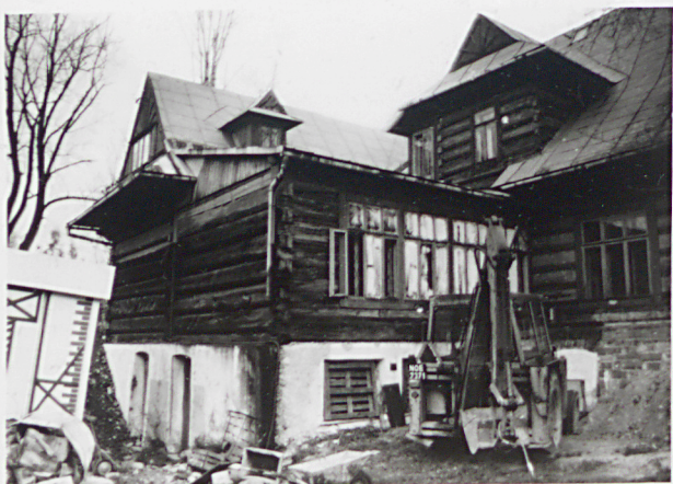
skrzydło północne budynku