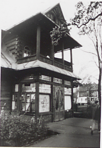
ganek elewacji frontowej