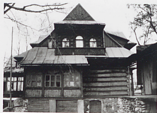
weranda elewacji zachodniej