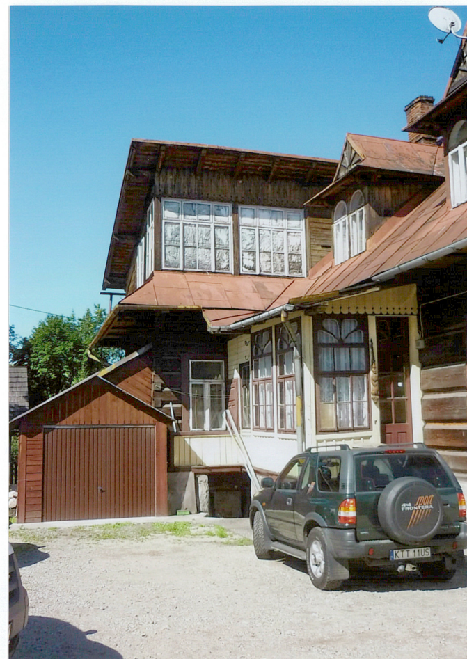
widok od zachodu