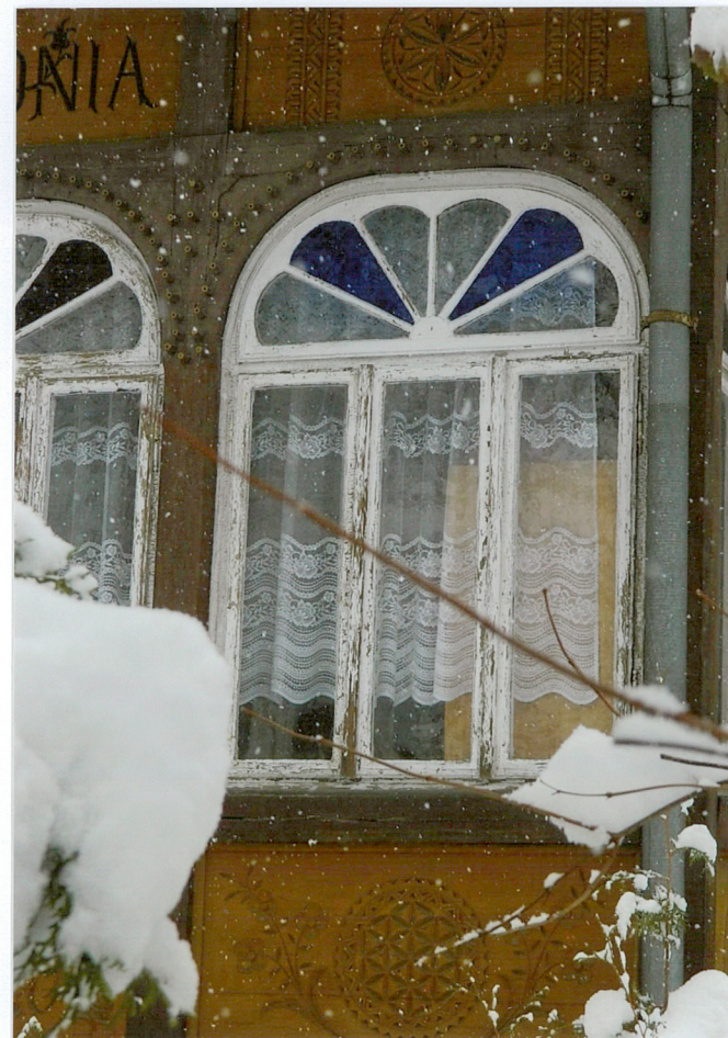
detal stolarki okiennej