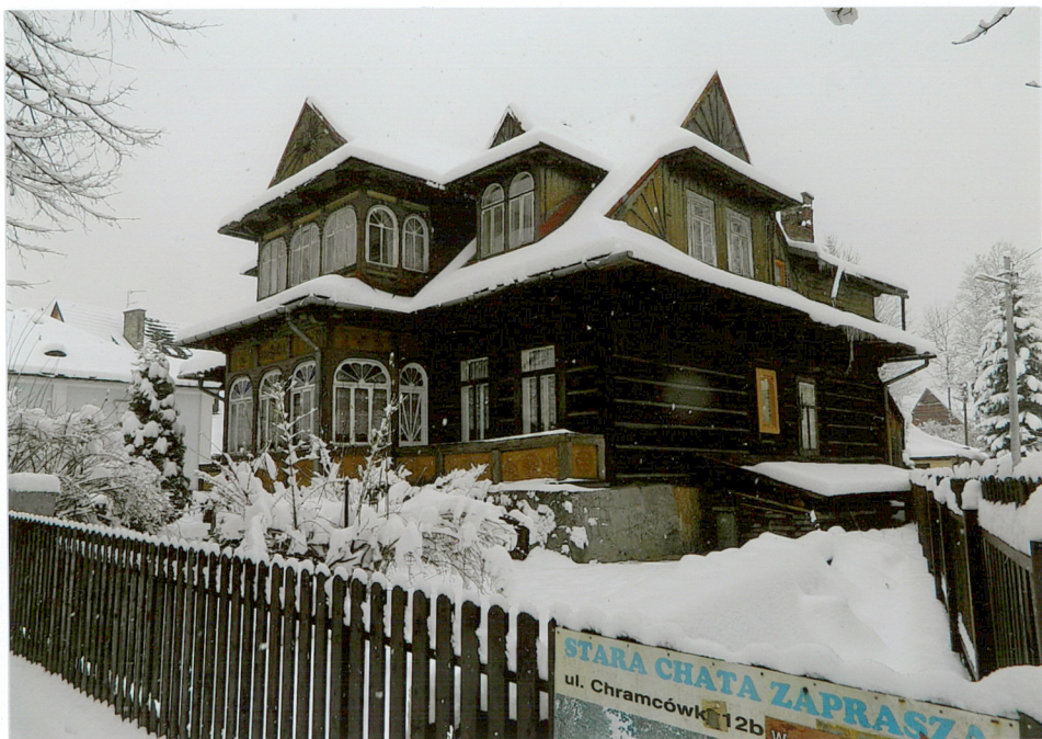
widok od północnego - wschodu