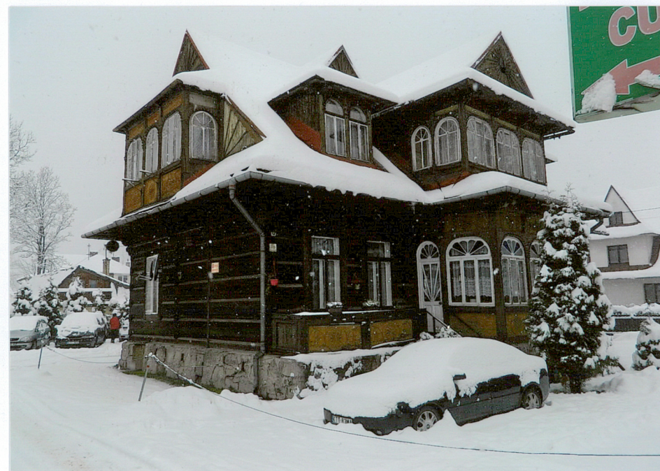
widok od południowego - wschodu

Wkładkę założył: mgr inż. arch. Oskar Huniak 2017 r.