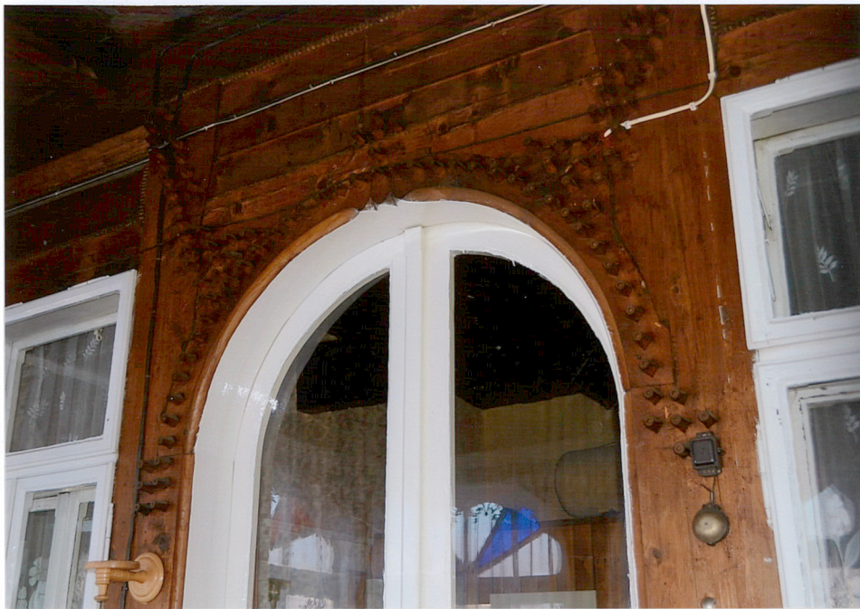
detal wewnętrznej stolarki drzwiowej