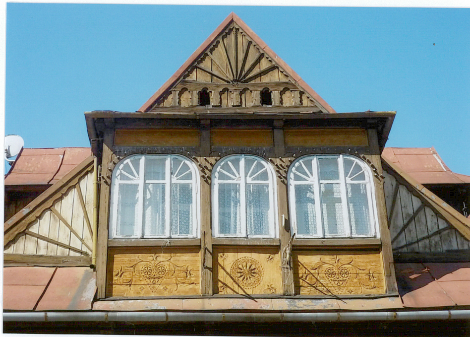
widok ściany szczytowej