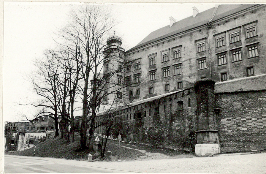
25257. Basteja (kaponiera) od strony ul. Grodzkiej z brama forteczna i odcinkiem murów obwodowych; po pr. fragment muru tzw. cegielkowego