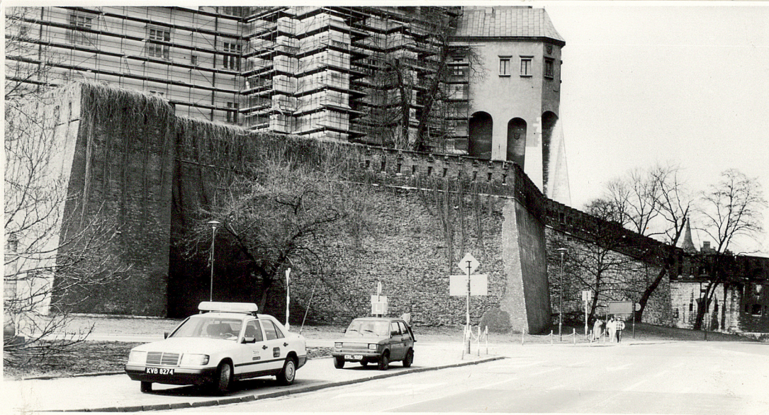
25279. Wsch. odcinek murów obwodowych z redanem