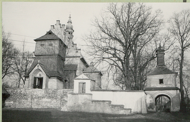
FOT. 1967 (2)