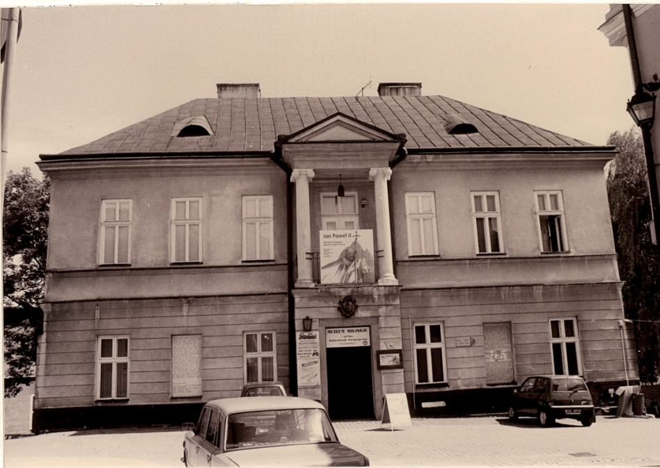
Widok od zachodu