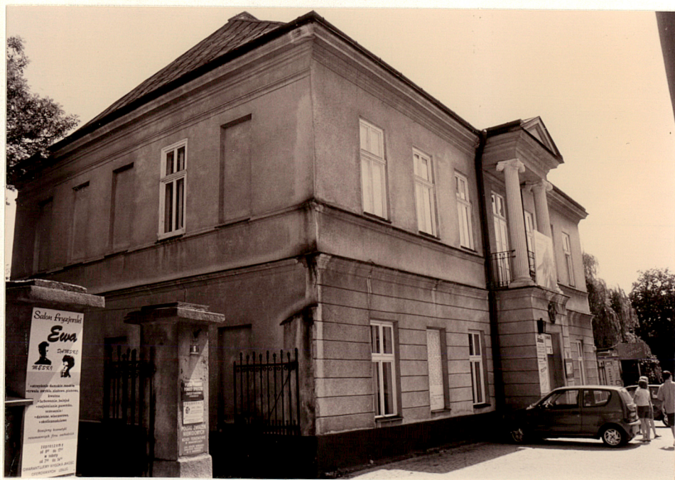
Widok od północnego-zachodu