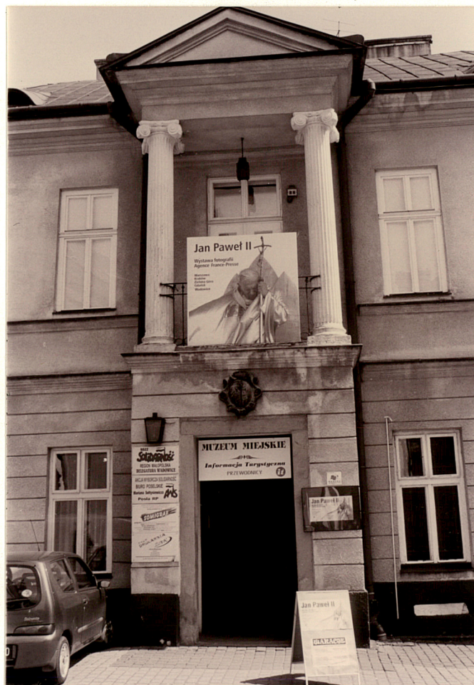
Ryzalit w fasadzie

część fasady potynkowana na gładko. Pomiędzy kondygnacjami poprowadzony jest gładki pas ujęty gzymsami. Fasada zwieńczona jest belkowaniem. Elewacja północna pięcioosiowa, potynkowana na gładko. Pomiędzy kondygnacjami poprowadzony jest gładki pas ujęty gzymsami. Elewacja zwieńczona fragmentem belkowania. Analogiczna elewacja boczna, południowa. Elewacja tylna sześćoosiowa (pierwotnie siedmioosiowa) z wydatnym ryzalitem w trzech osiach środkowych zwieńczonym belkowaniem i trójkątnym przyczółkiem. wejście do sieni w kondygnacji wysokiego parteru poprzedzone dwubiegowymi schodami z obszernym podestem. Pomiędzy kondygnacjami nadwieszony balkon z ażurowaną balustradą z metalowych prętów.