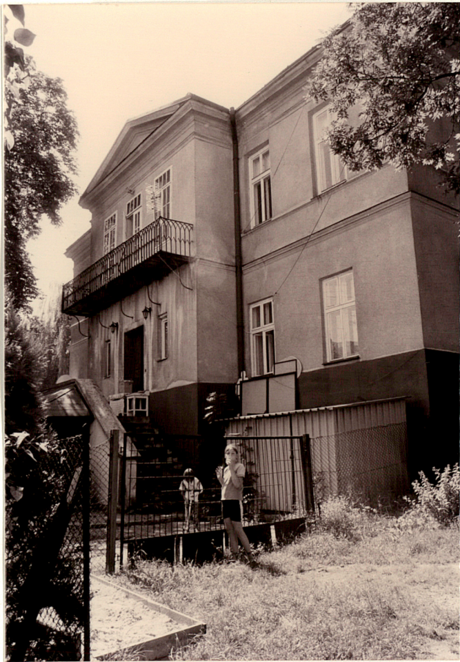
Widok od północnego-zachodu