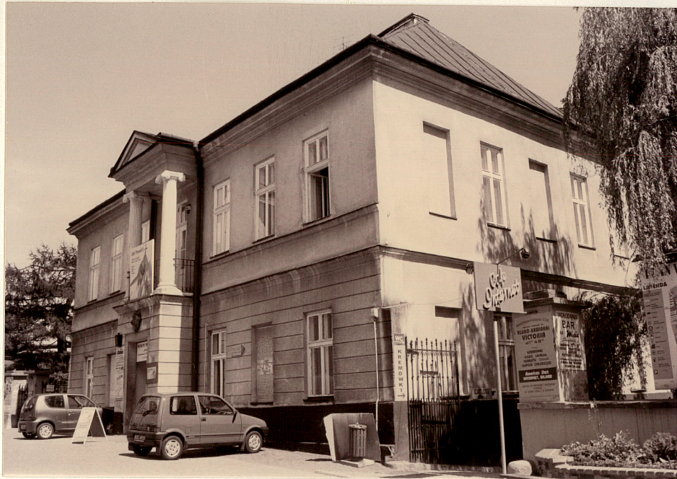
Widok od południowego-zachodu