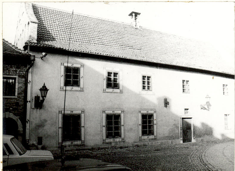
8. Elewacja frontowa - wejście główne