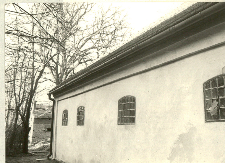
Okna w ścianie południowej