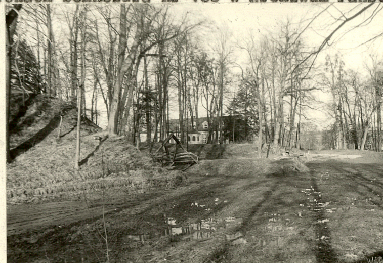
Ususzony staw na pld.-wschód od dworu