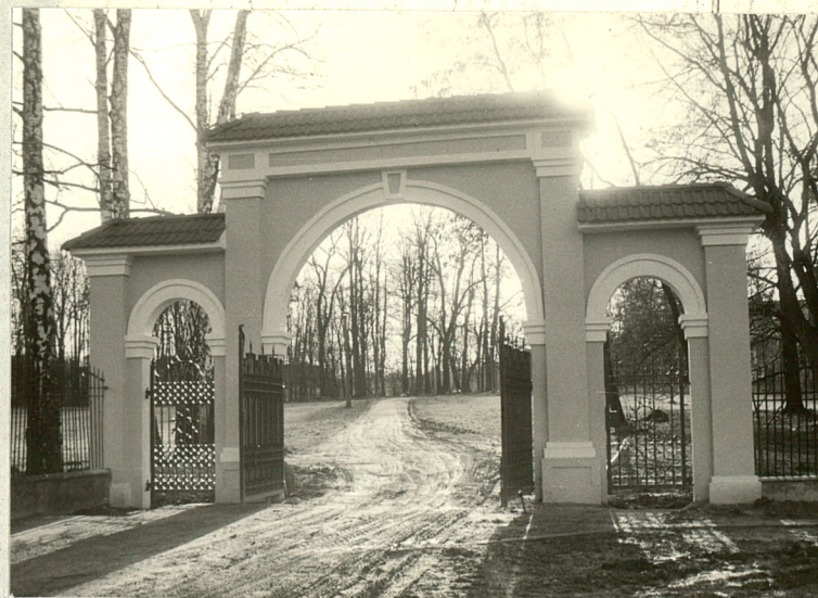
Główna brama wjazdowa na teren zespołu