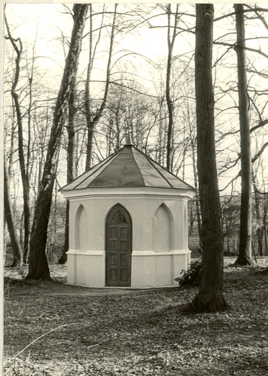
Kapliczka w parku

Fotografie dodatkowe + plan sytuacyjny zespołu