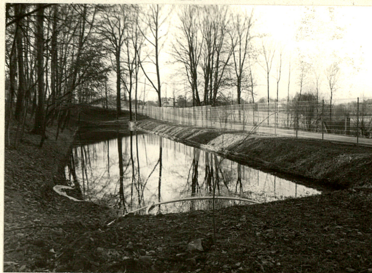
Zbiornik wodny w zachodniej części parku przy ogrodzeniu