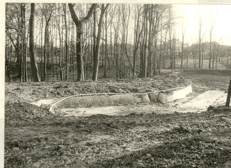
Basen przy stawie na południowy-wschód od dworu