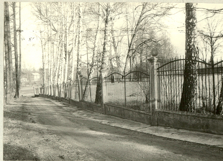
Fragment ogrodzenia od pñ.-wschodu