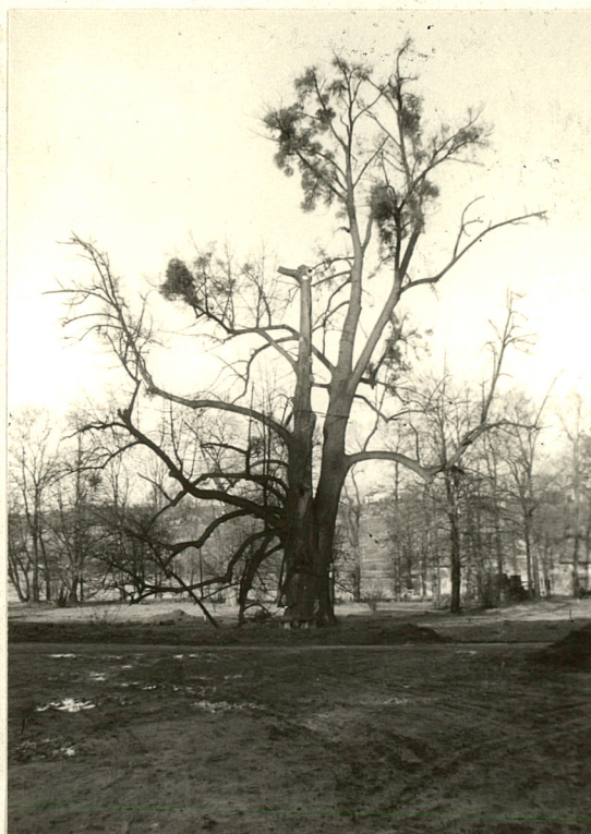
300-400 - letnia lipa przed fasadą dworu

Fotografie dodatkowe + Widoki nieistniejącej zabudowy w zespole dworskim. Litografia z 1863 r. Winieta na papierze firmowym Zakładu Nasion Pastewnych w Kleczy Górnej przechowywana w Tekach Schneidra nr 738 w Archiwum Państwowym na Wawelu.