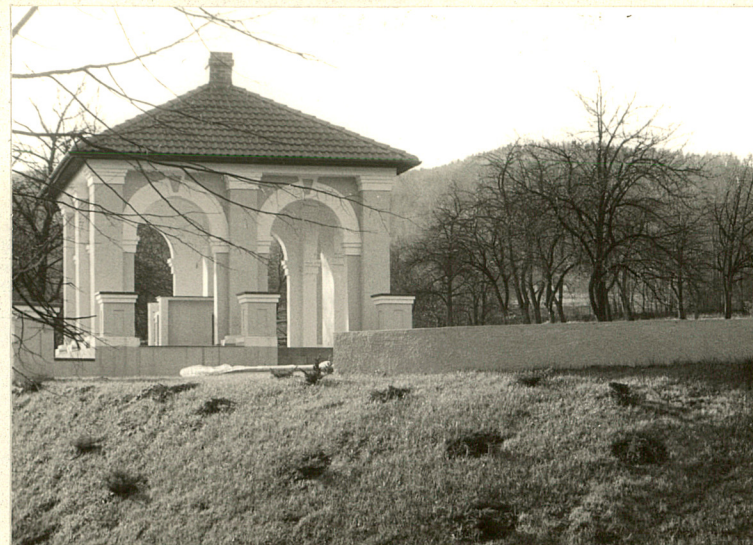
Altana na południe od dworu