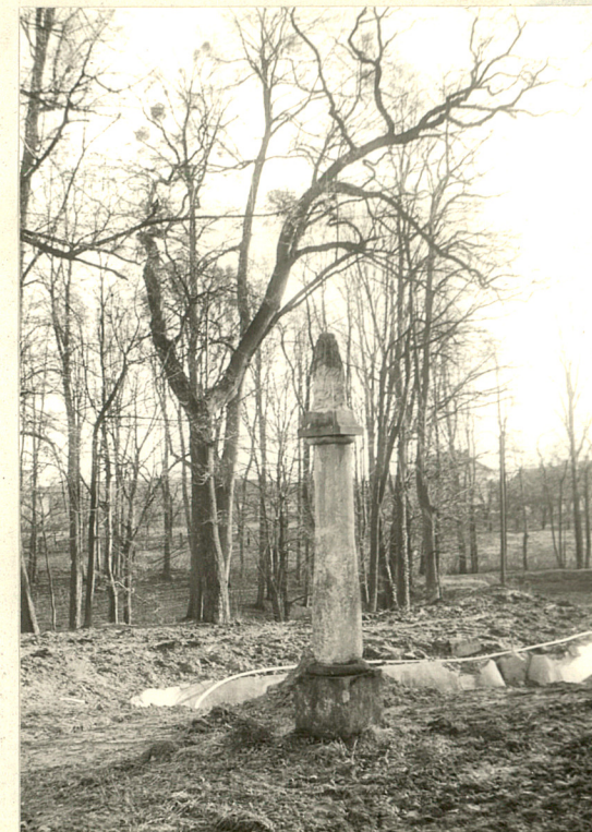
Figura w parku