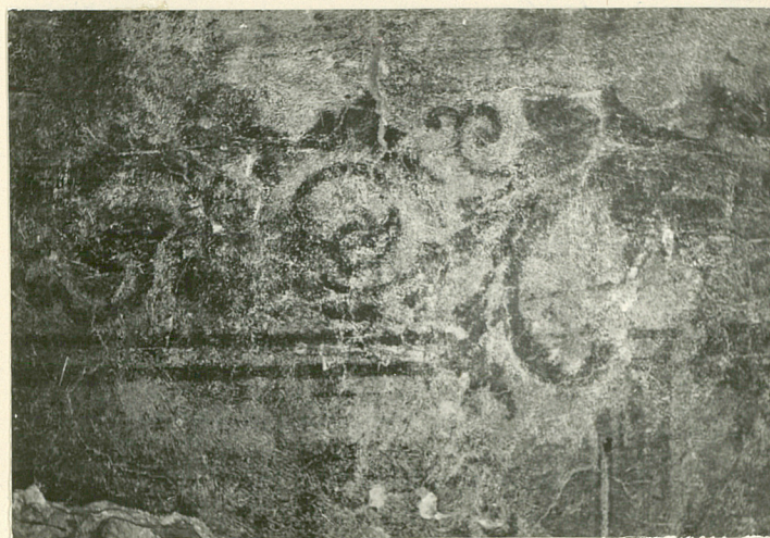
10 - 12. fragment dekoracji malarskiej z motywami ornamentálnymi (wnętrze, ściana pd.)