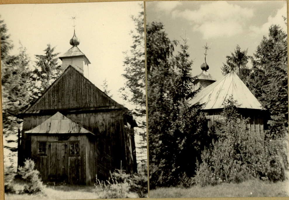
31. Szkic sytuacyjny, plan schematyczny, uwagi opisowe, fotografia