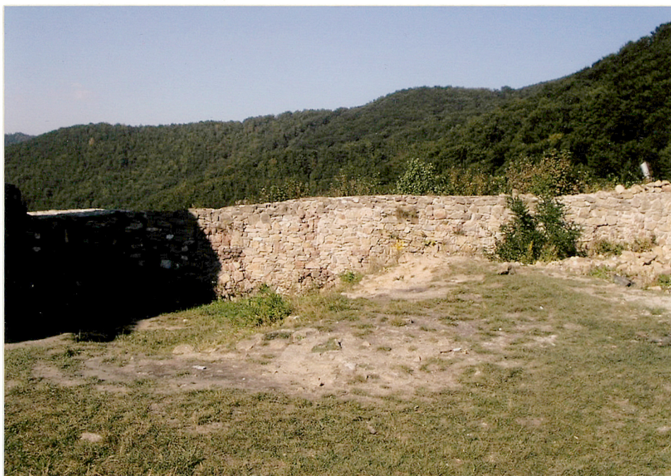
północna kurtyna murów