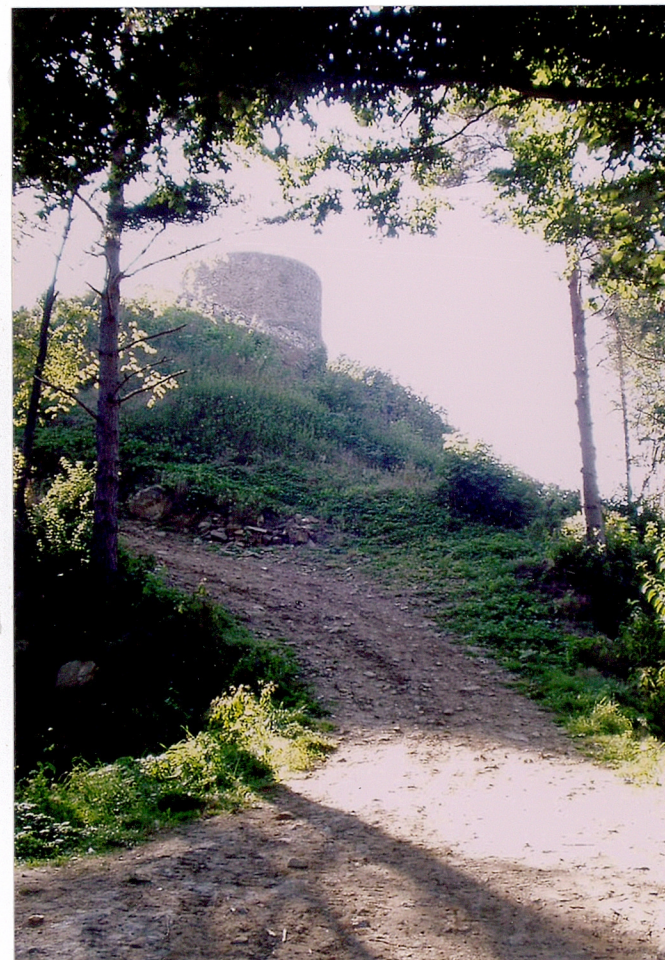
droga na zamek od strony północnej