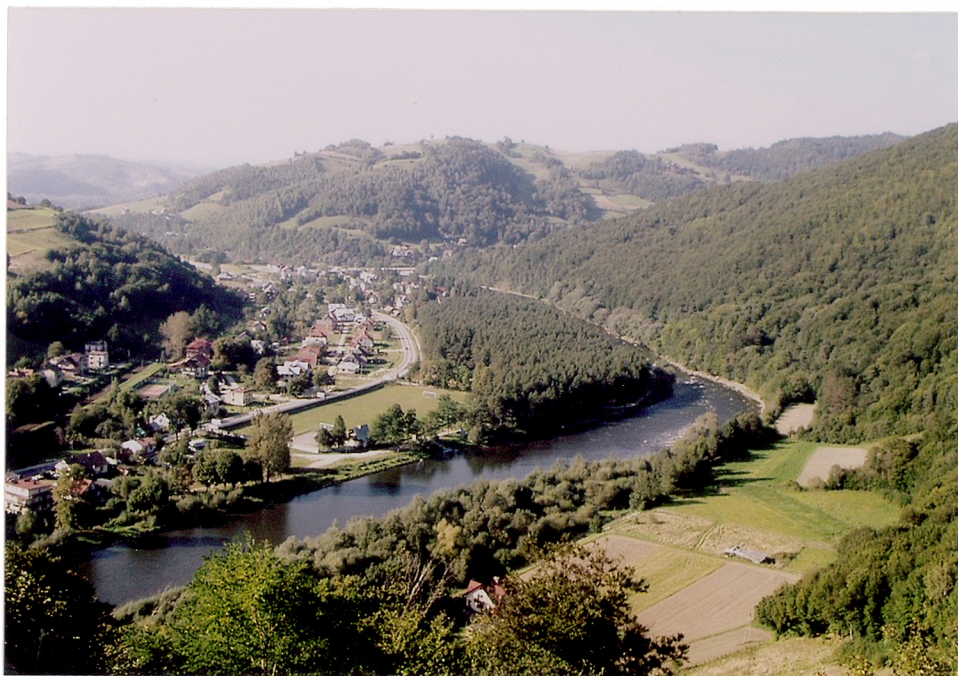
widok z zamku na dolinę Popradu