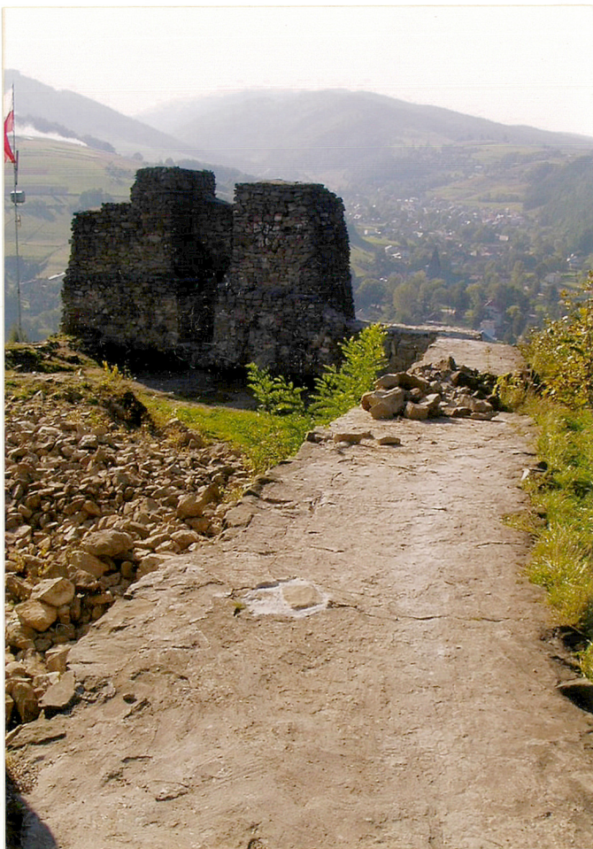
północna kurtyna murów