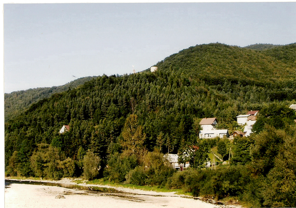
widok zamku od płd-zach.