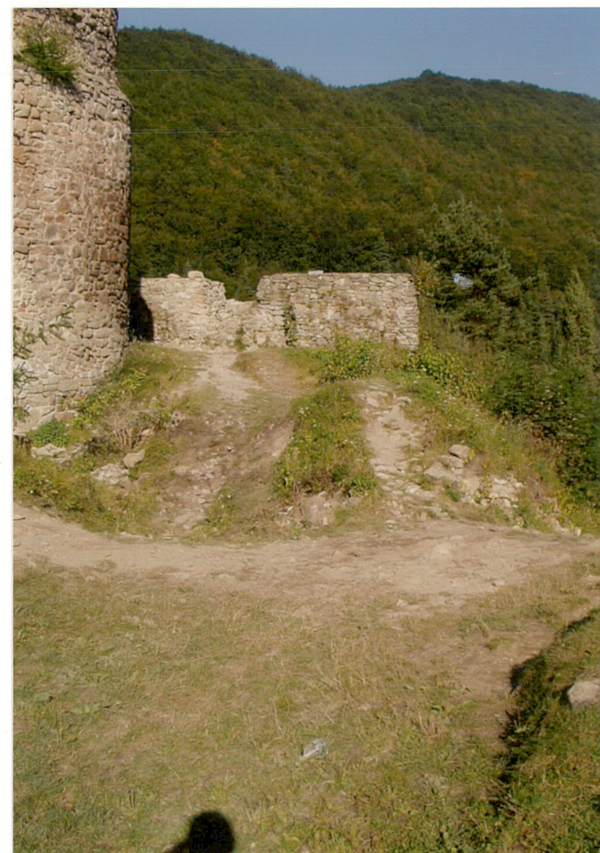
miejsce po dawnej bramie wjazdowej na zamek