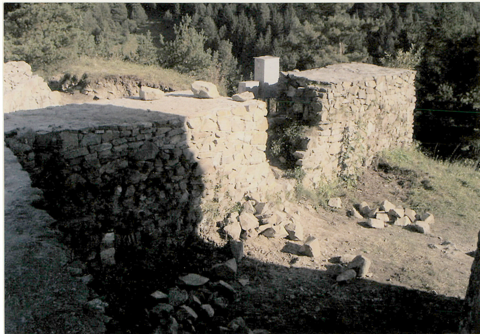
mury w odcinku północnym i północno-wschodnim