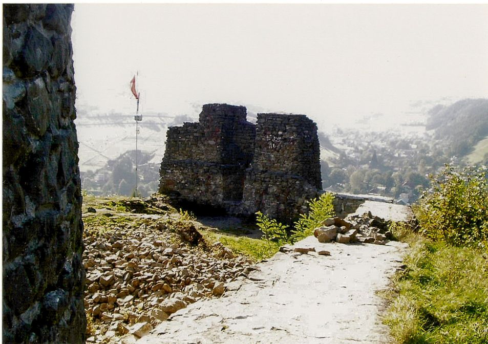
fragment murów budowli w północno- zachodnim odcinku murów zamkowych