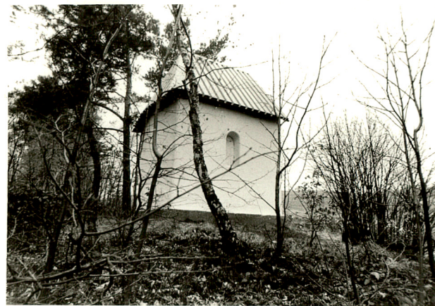
widok od północy