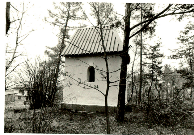
widok od północno-wschodu