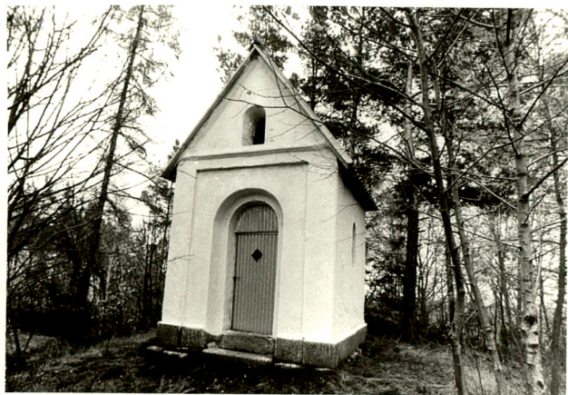
widok od zachodu

3. Zawartość wkładki (nazwa obiektu lub materiału uzupełniającego)