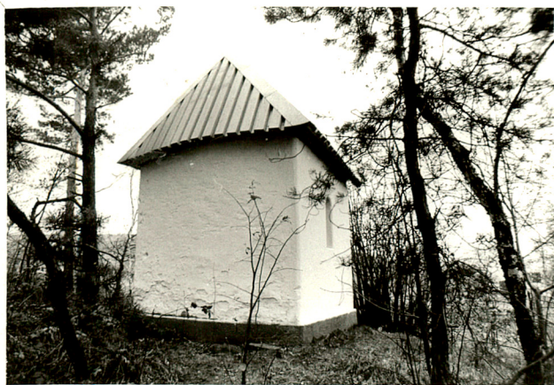
widok od wschodu