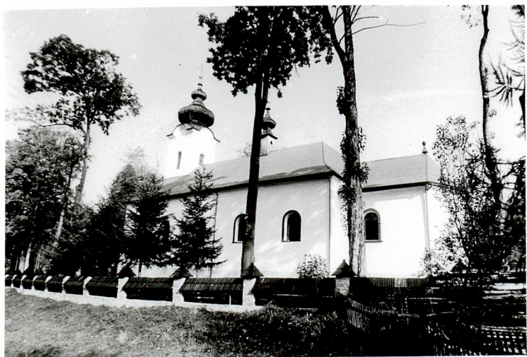
widok od półd-wsch.