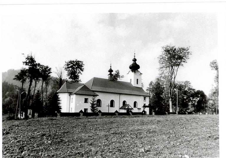
widok od północy