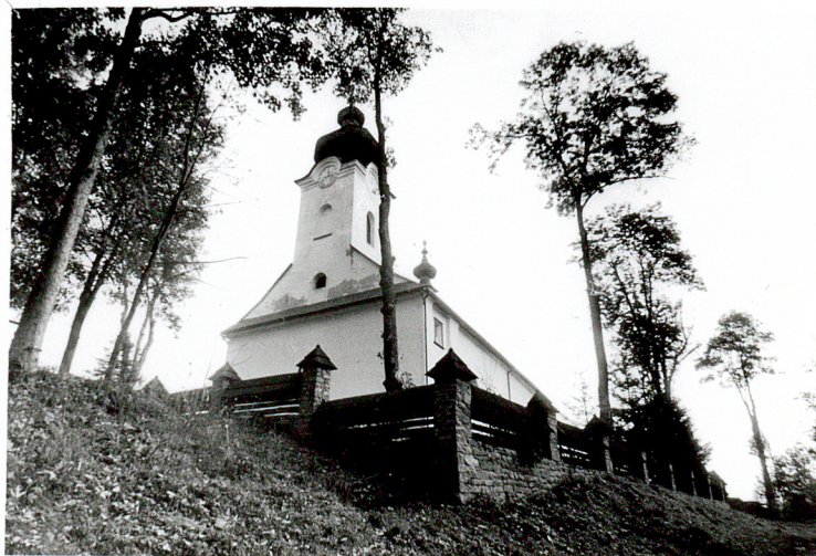
widok od zachodu