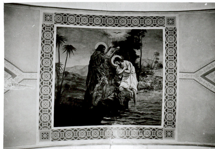
fragment polichromii stropu