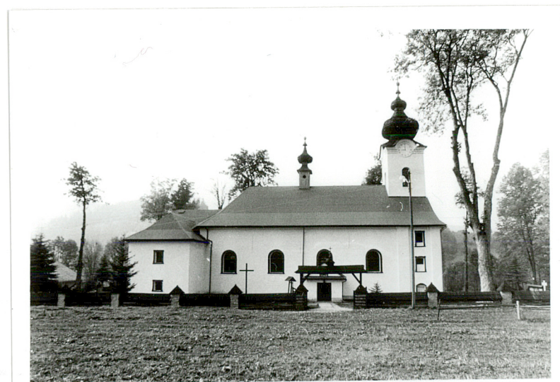
widok od północy

Feretrony ze starymi obrazami (6) z XVIII-XIX wieku. Dzwon z 1924 roku.