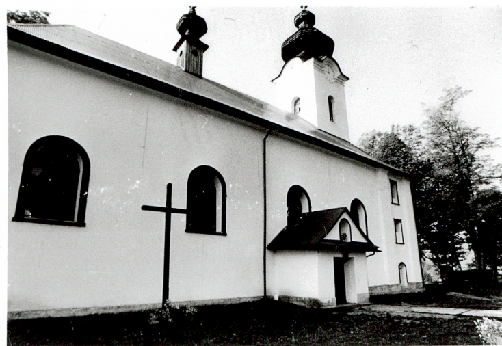
widok od północy