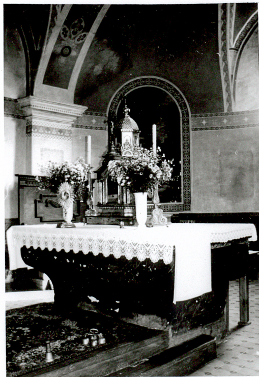
ołtarzyk z tabernakulum w prezbiterium