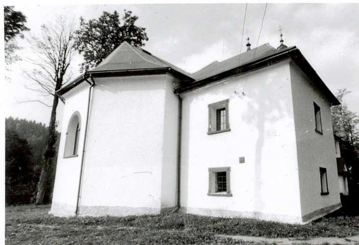
widok od wschodu

mgr M. H. Grabski IX 2002 r. Wkładkę założył : ..... (Imię, nazwisko, data) Miejsce przechowywania negatywów: ..... archiwum autora