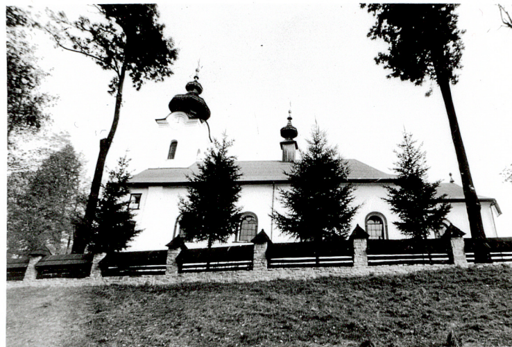
widok od południa