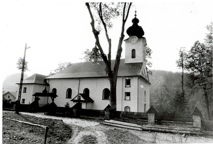
widok od półn-zach.