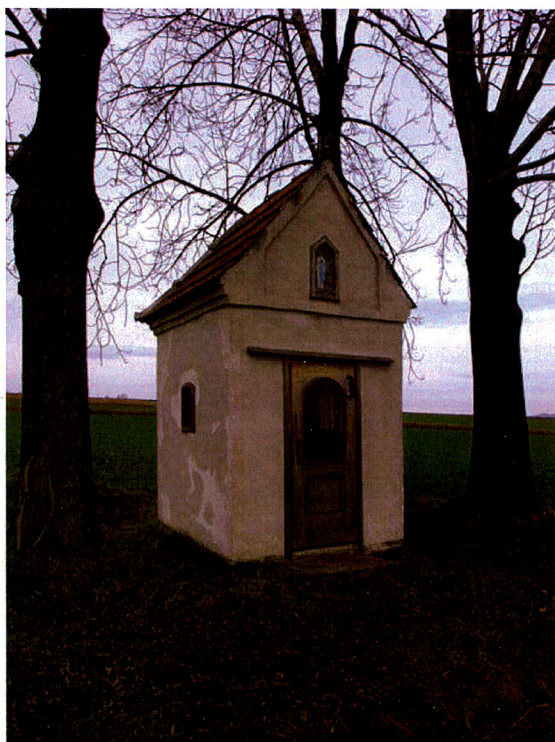
widok od wschodu