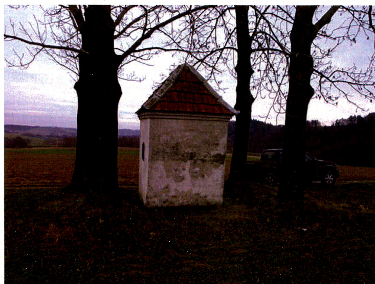
widok od zachodu