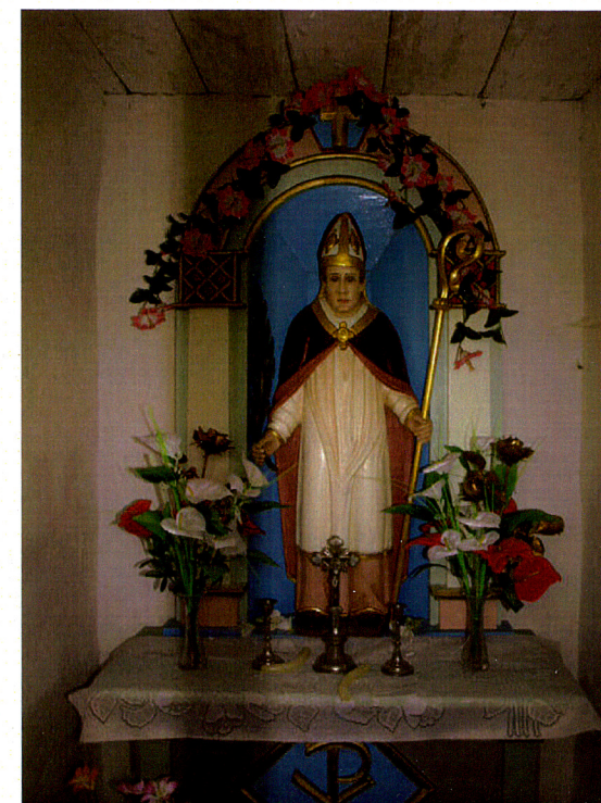
posąg Św. Wojciecha Bpa