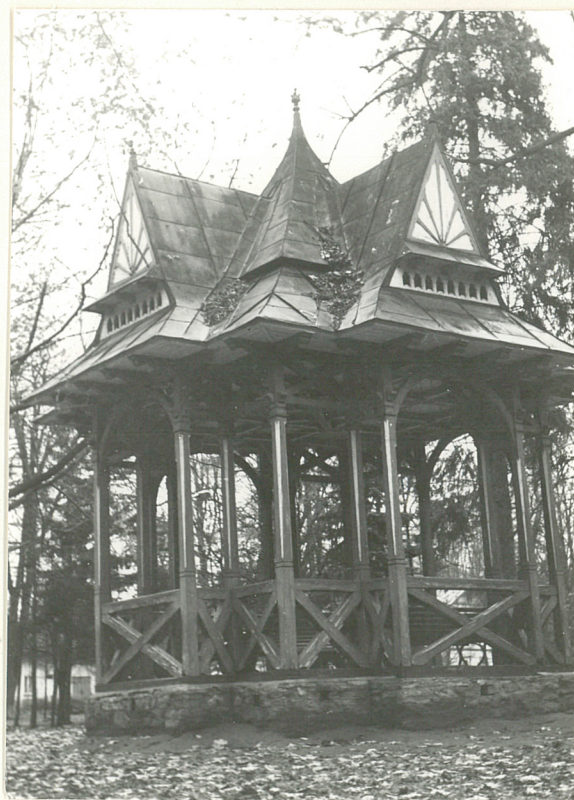
3. Widok od zach.