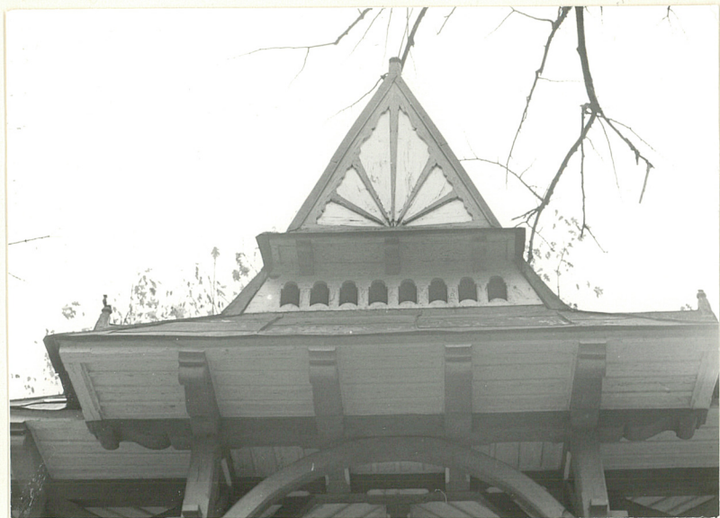
5. Szczyt od płu.