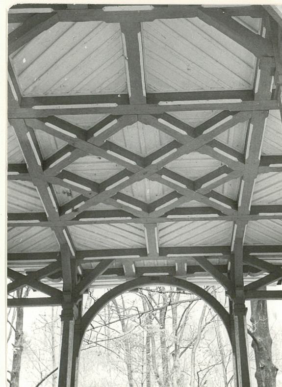
4. Fragment stropu