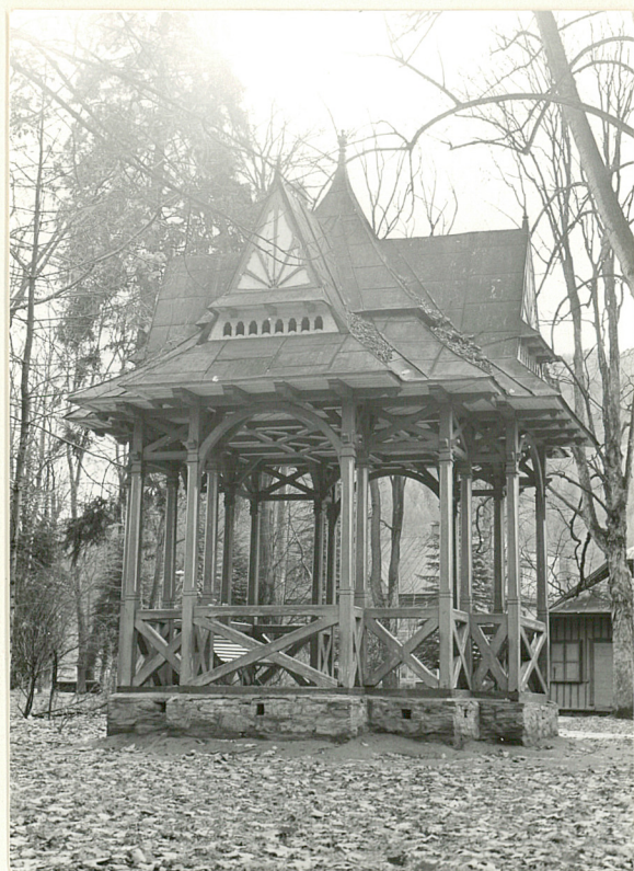
2. Widok od płu.