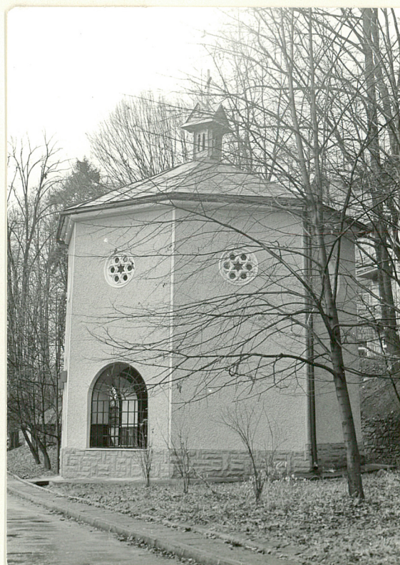
3. Elewacja wsch.