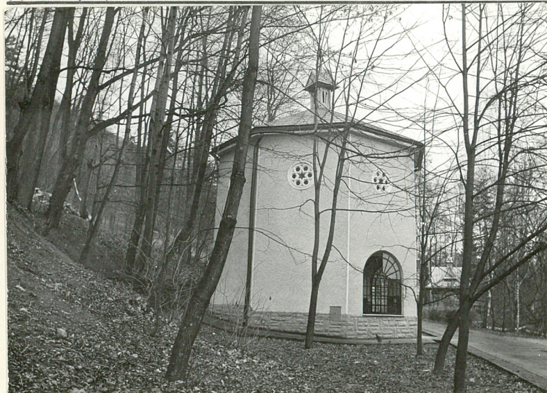
1. Widok ogólny