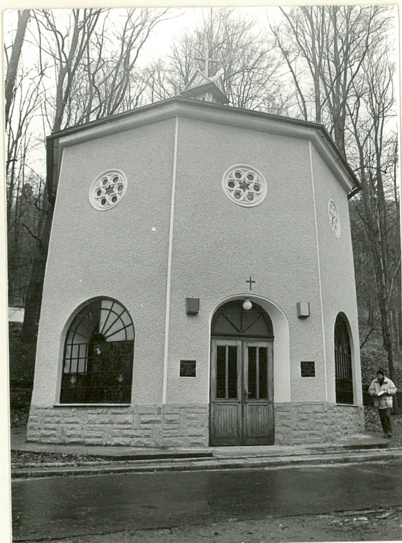
2. Elewacja pld.