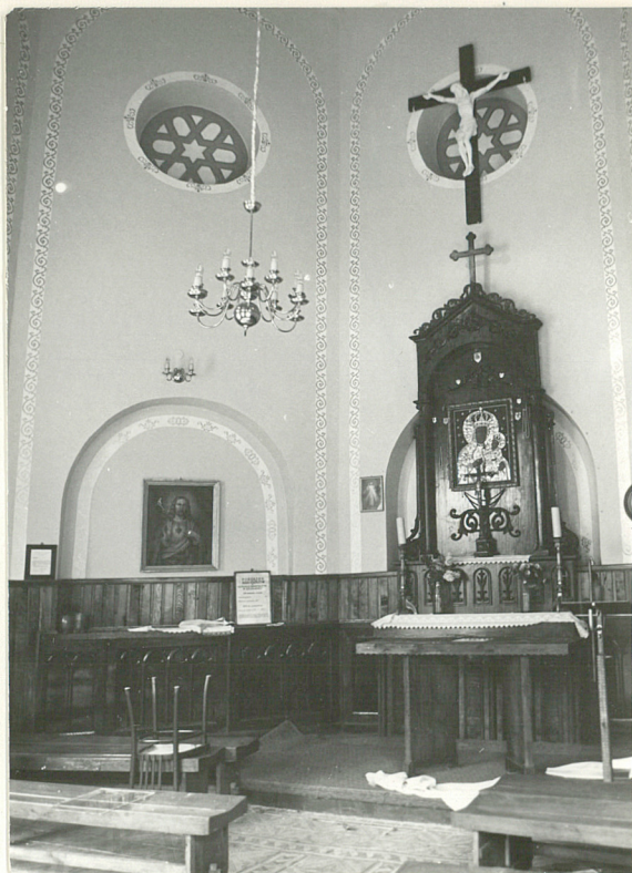
6. Wnętrze .