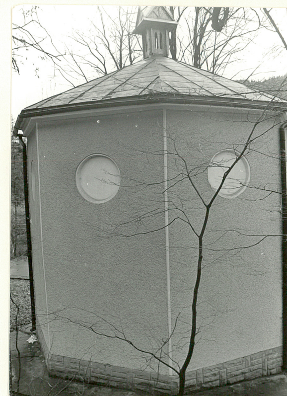
4. Elewacja pñn.

Wkładkę założył: K Wrzeszcz XI 1990 (imię, nazwisko, data)