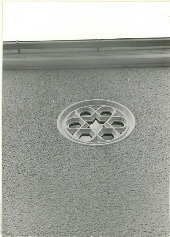
5. Okno w elewacji zachodniej