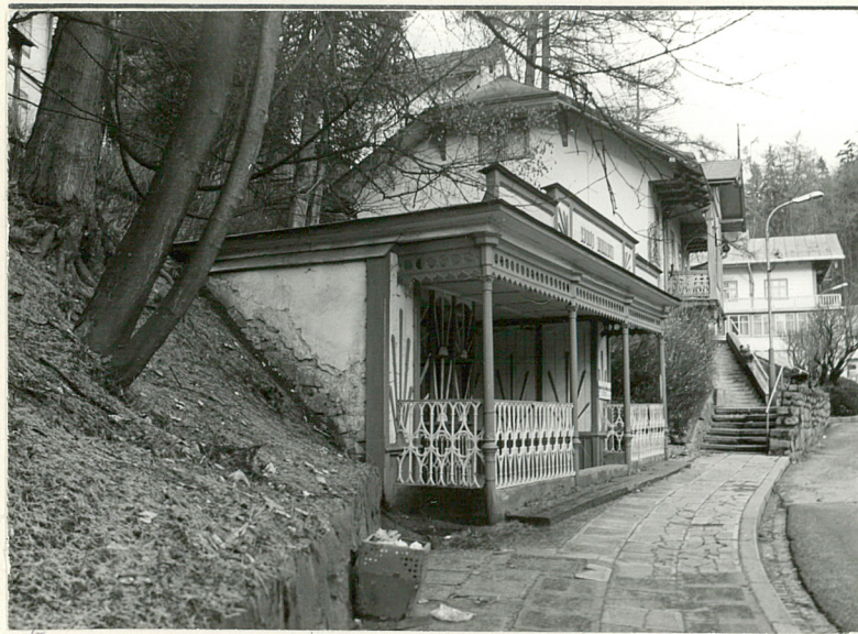
1. Widok ogólny