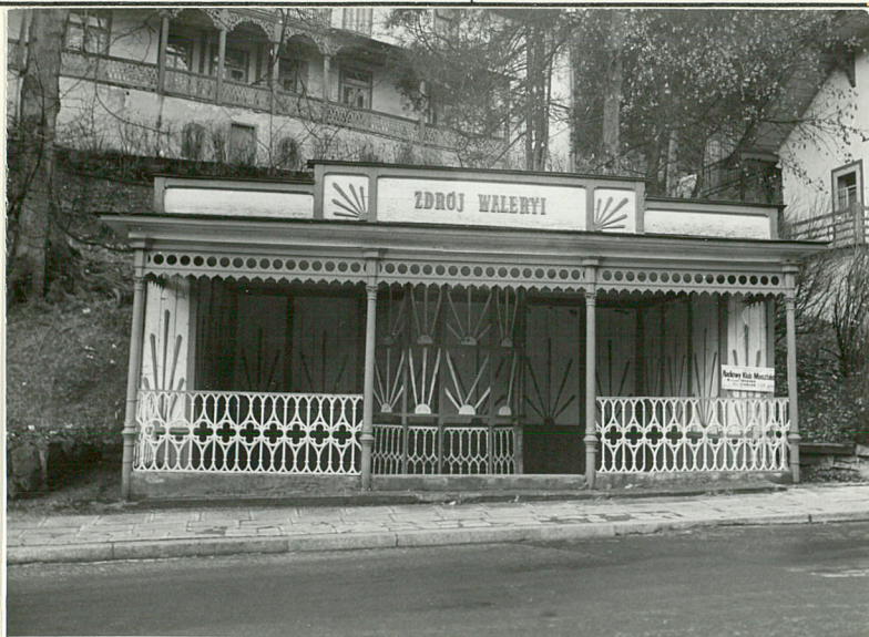
2. Elewacja pld.