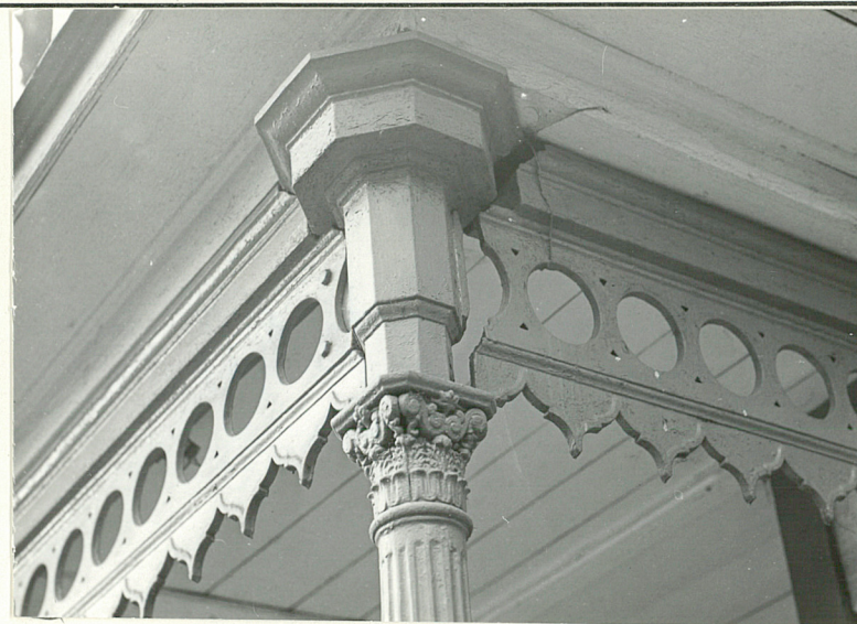
3. Detal architektoniczny .

Wkładkę założył: K. Wrzeszcz, XI 1990 (imię, nazwisko, data)