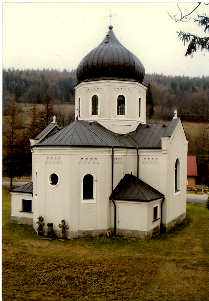
widok od płn-wsch.