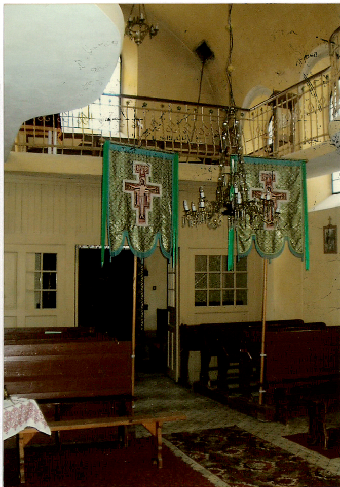
widok na balkon w babińcu