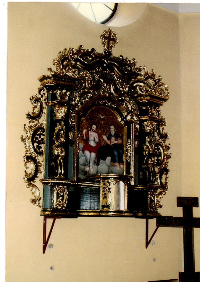
ołtarzyk rokokowy z XVIII w. w prezbiterium