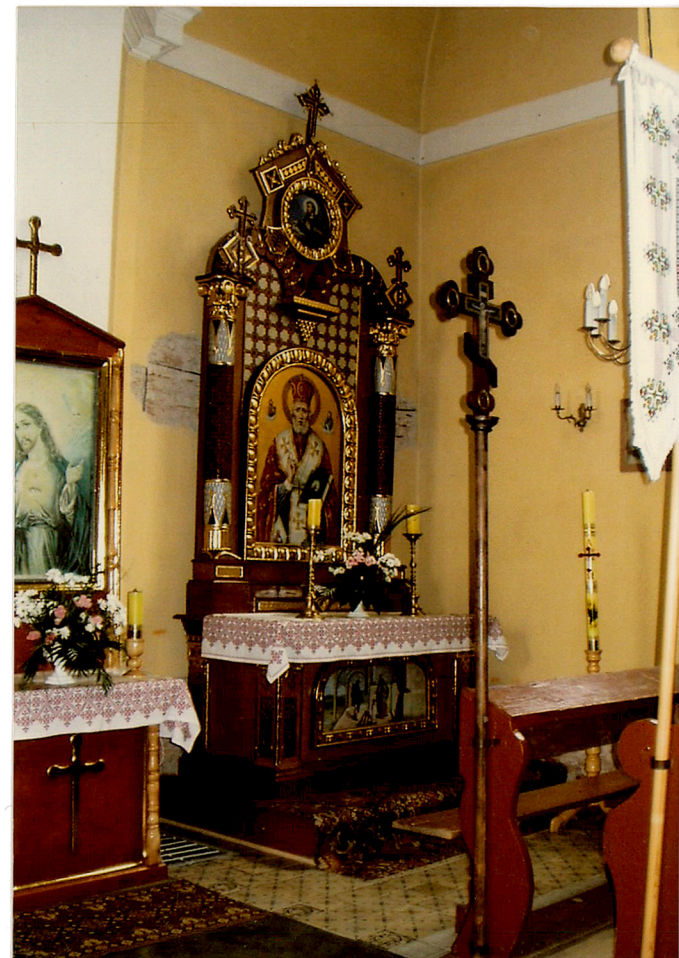
ołtarz boczny /prawy/