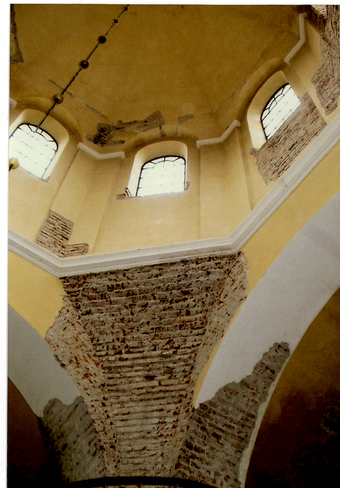
kopuła nad nawą