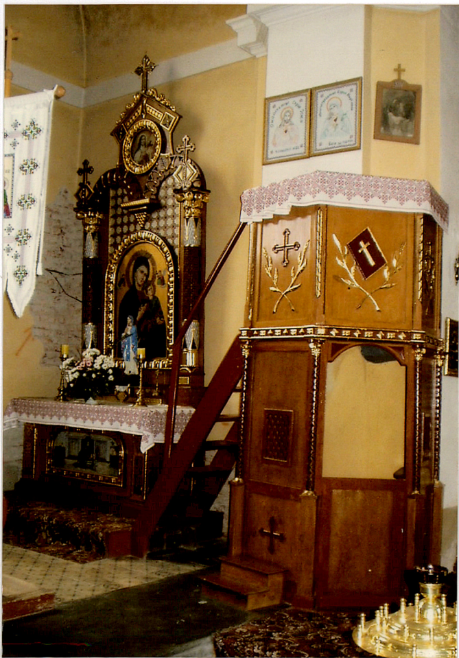
ołtarz boczny /lewy/