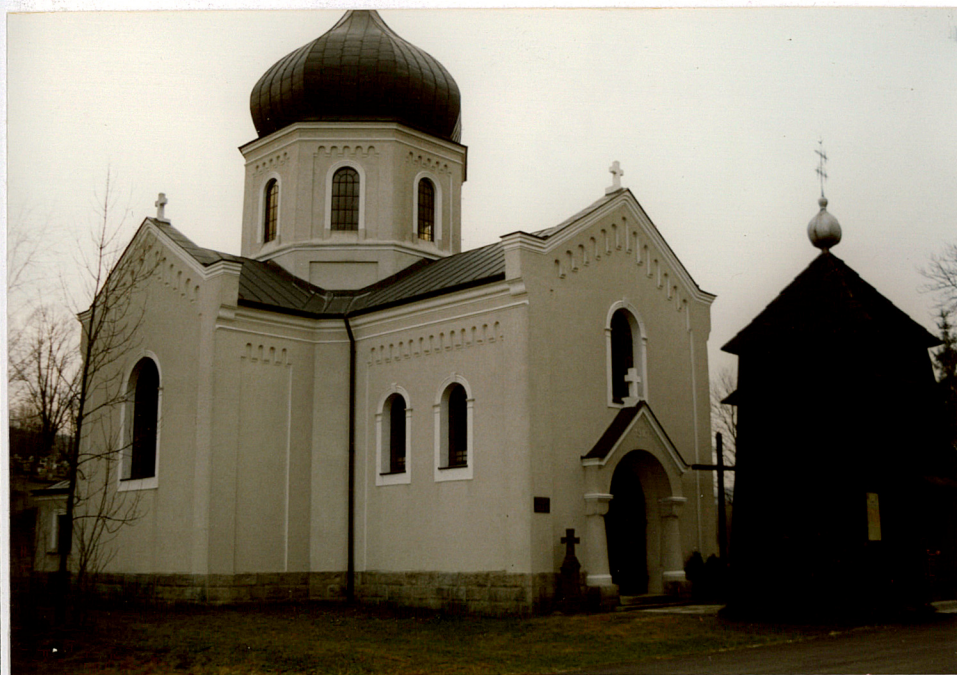
widok od płn-zach.