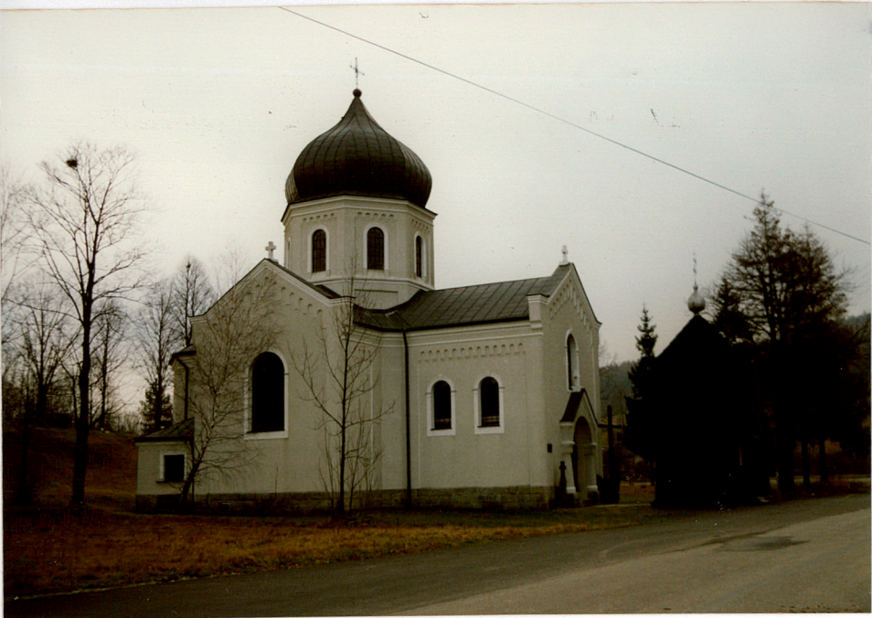
widok od płn-zach. widok od płd-wsch.