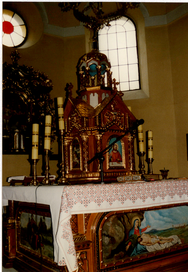
ołtarz w prezbiterium