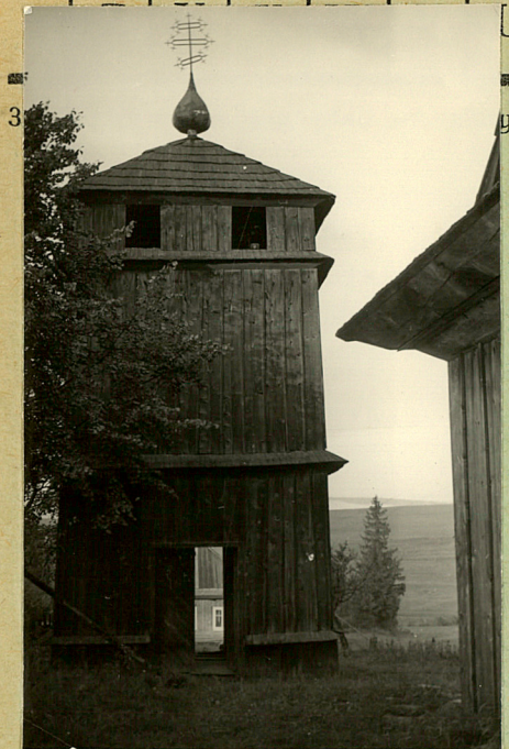
zwraca uwagę szalunek ścian wykonany z desek szerszych niż w górnej partii. Wewnątrz podłoga z desek.