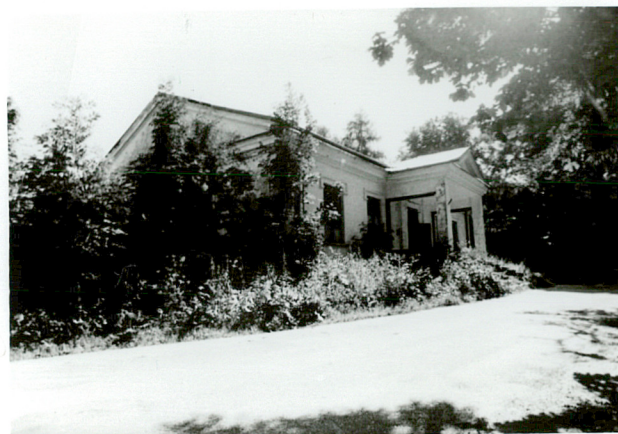
widok od płd-zach.