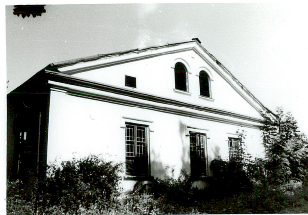
widok od płn-zach.