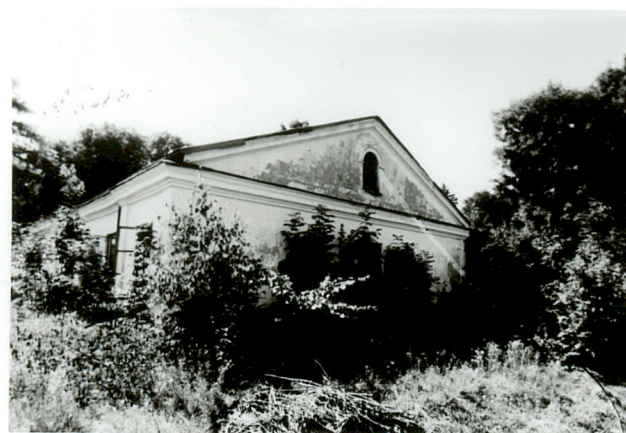
widok od wschodu