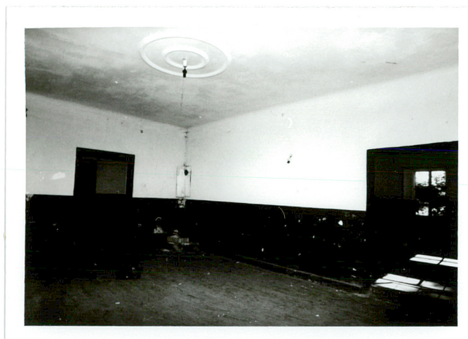
jedno z pomieszczeń traktu frontowego