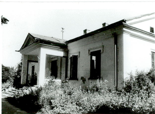
widok od płd-wsch.