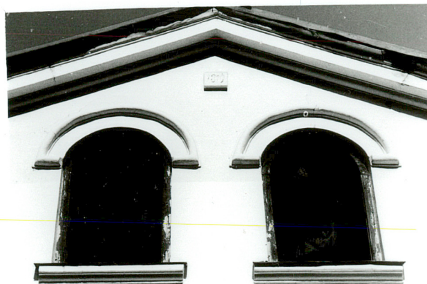
otwory okienne w szczycie