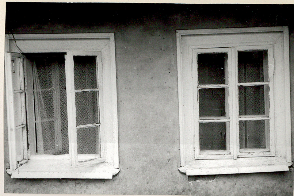
Detale: ganek, okna; fot. Z. Beiersdorf, listopad 1979.