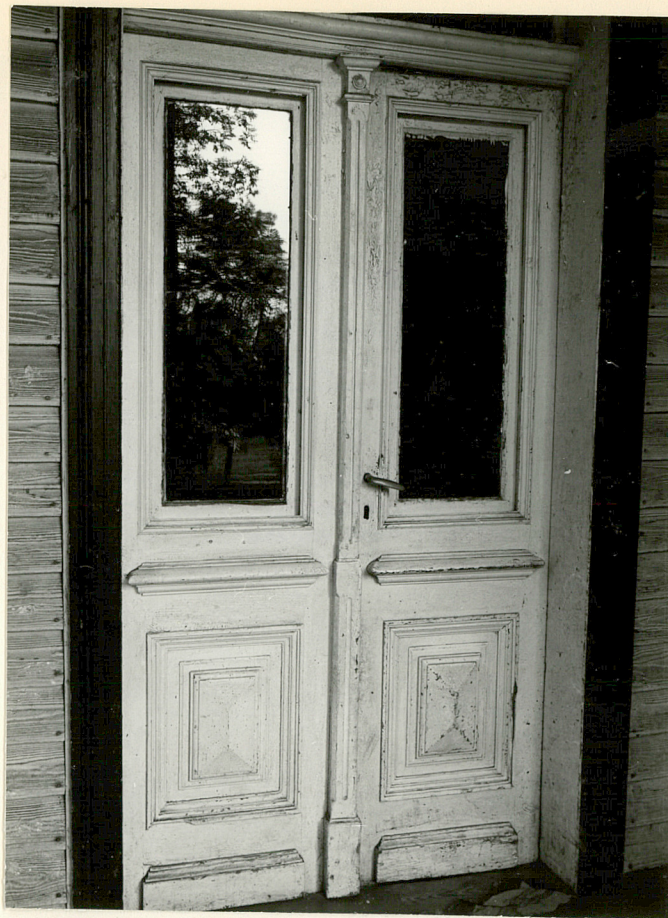
Zdjęcia dodatkowe: 7. Fryz podokapowy i facjaty; 8. Stolarka drzwi wejściowych. Fot. T.Kalarus, PKZ Kraków, neg. 24578/A, 14577/A.