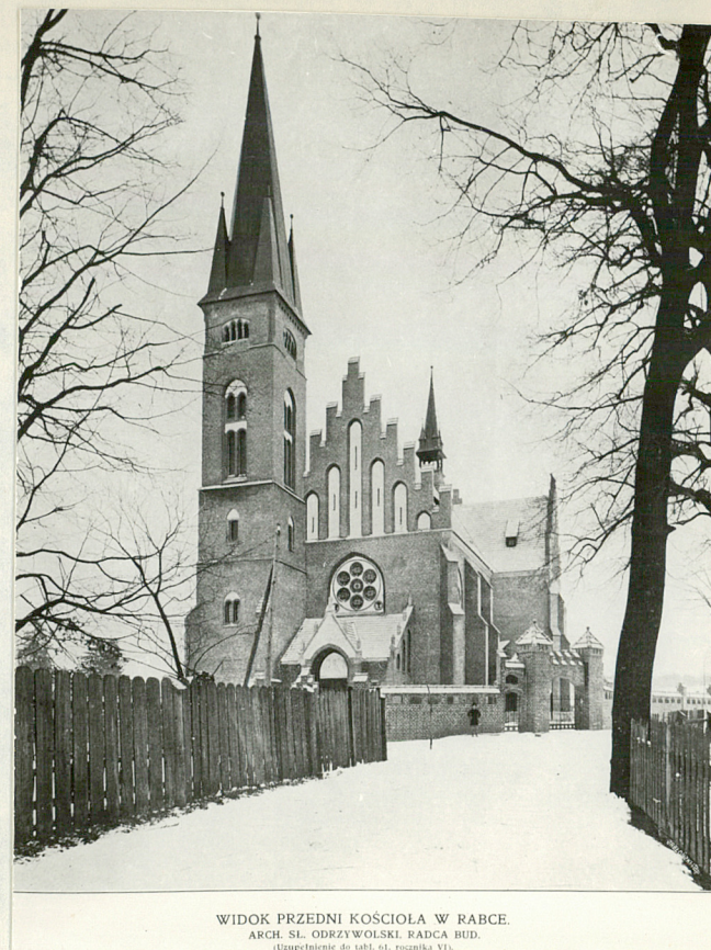
WIDOK PRZEDNI KOŚCIOŁA W RABCE. ARCH. SŁ. ODRZYWOLSKI. RADCA BUD. (Uzupełnienie do tabl. nr. rocznika VI.)