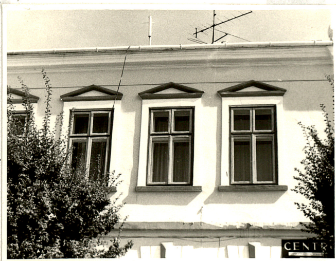
otwory okienne piętra fasady