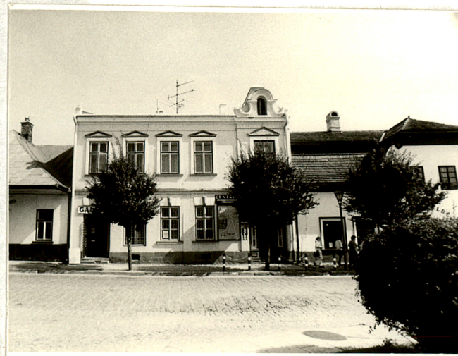
widok od zachodu

Budynek posiada instalację elektryczną i wodno-kanalizacyjną.