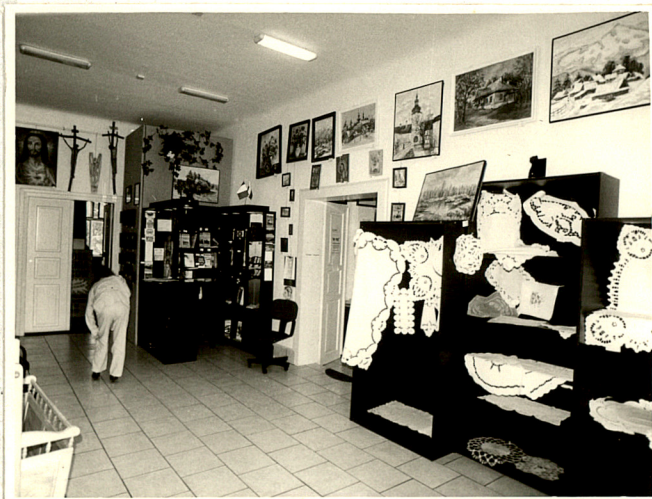
pomieszczenia galerii w trakcie frontowym budynku