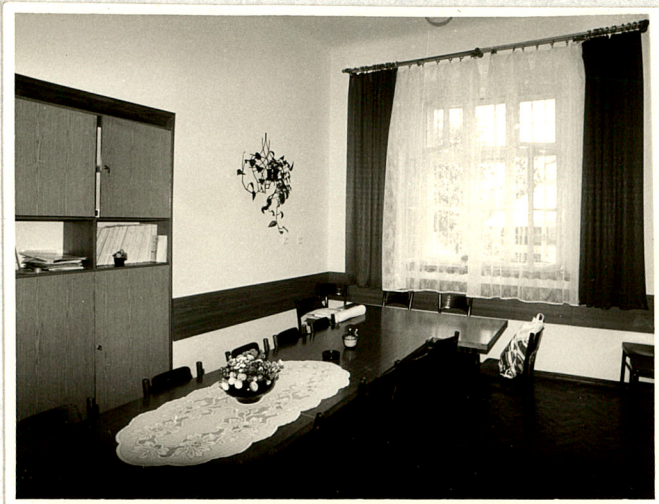
pomieszczenia biurowe PSL w trakcie tylnym