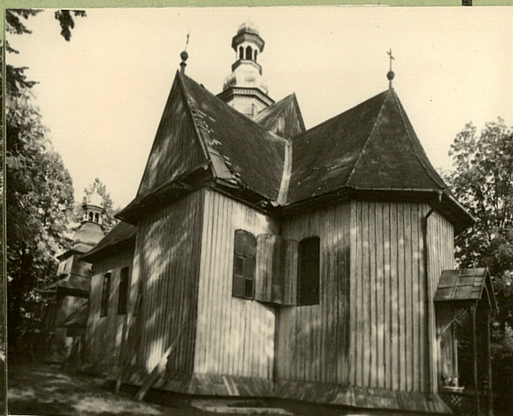
A black and white photograph of a wooden church with a prominent steeple and multiple gables. The church is constructed of vertical wooden planks. It features a complex roofline with several gables and a tall, multi-tiered steeple. The church is surrounded by trees, and the overall scene is captured in a historical, sepia-toned style.