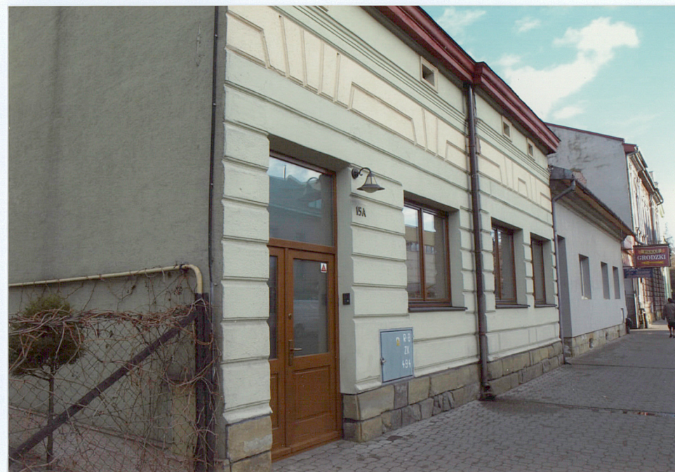
widok od południowego-zachodu)