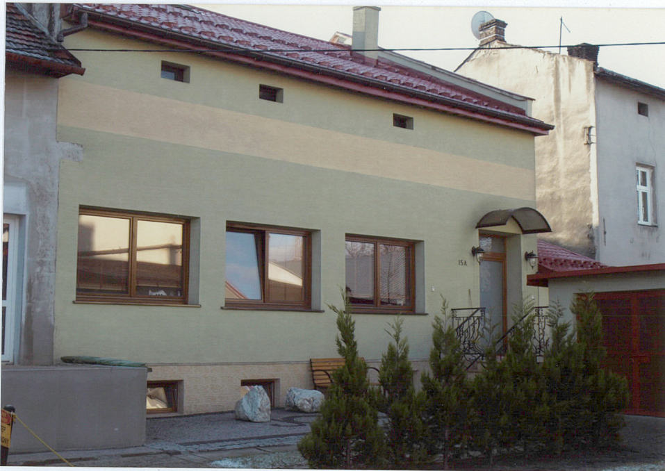
elewacja tylna (północna)