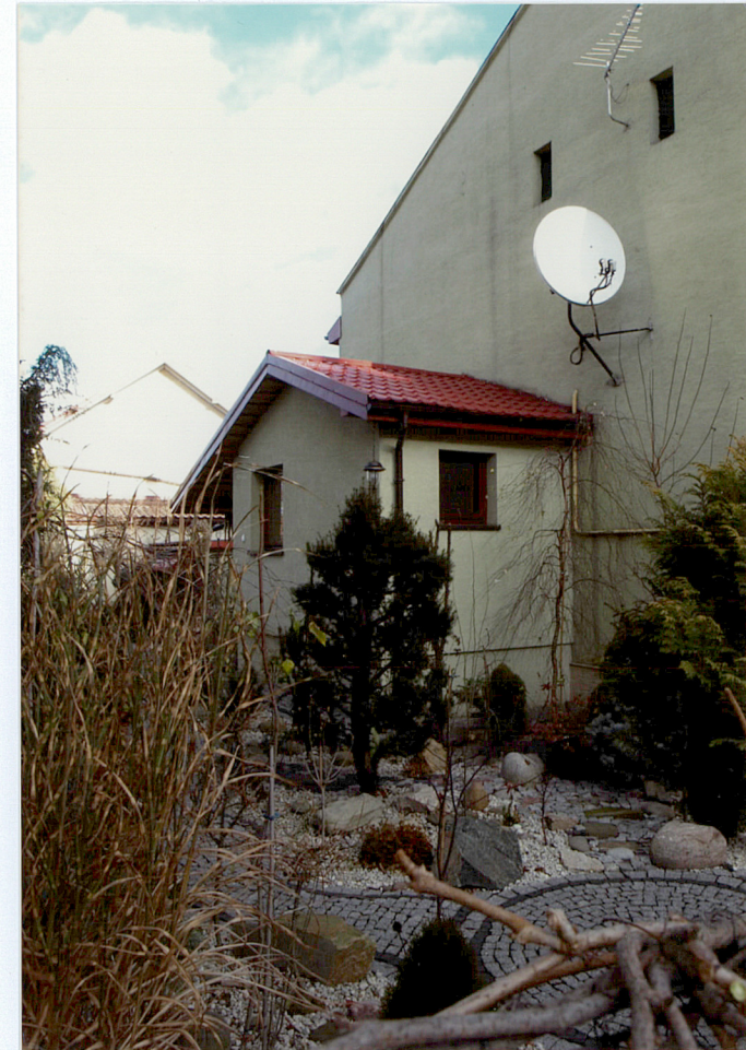
ganek przy elewacji bocznej (zachodniej)