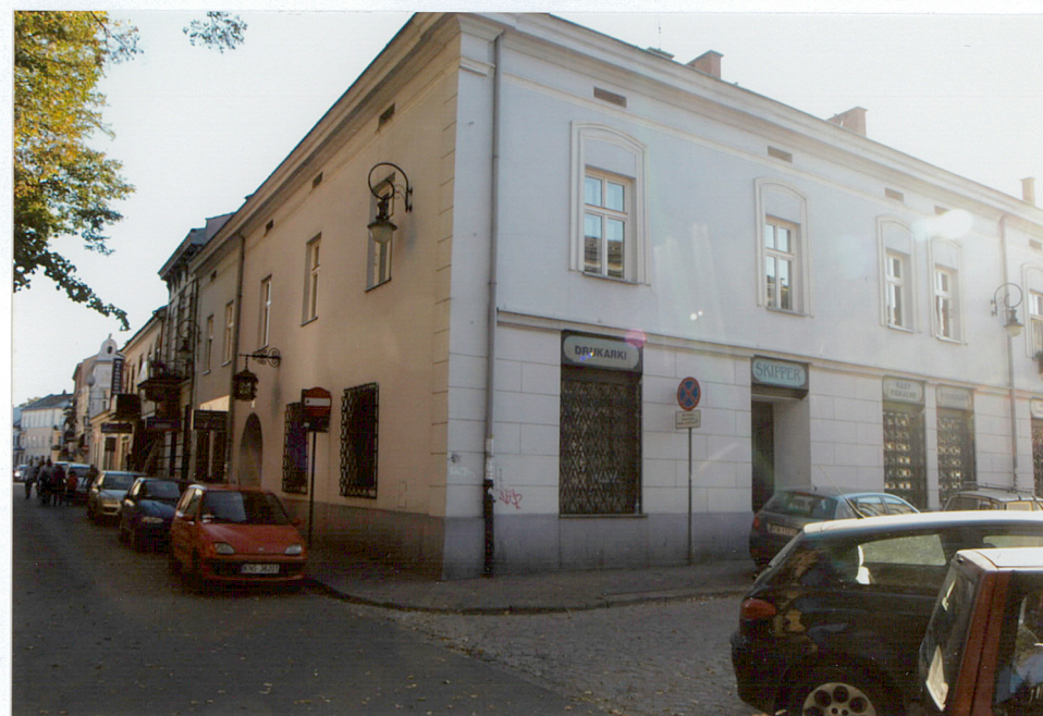
widok od wschodu