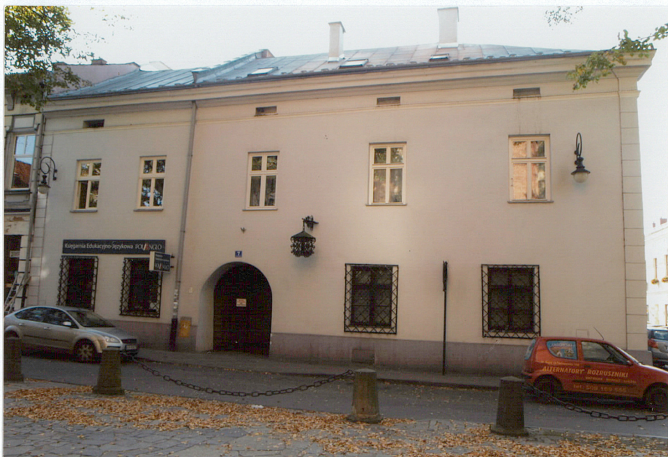
widok od północnego-wschodu