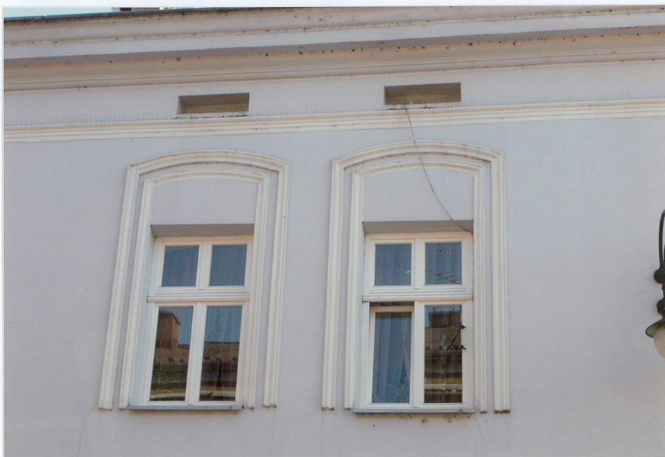
otwory okienne fasady