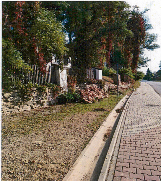
Mur otaczający Dwór od strony stawu

8. Fotografia z opisem wskazującym orientację albo mapa z zaznaczonym stanowiskiem archeologicznym