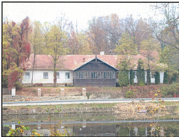
Mur wraz z dworem od strony stawu