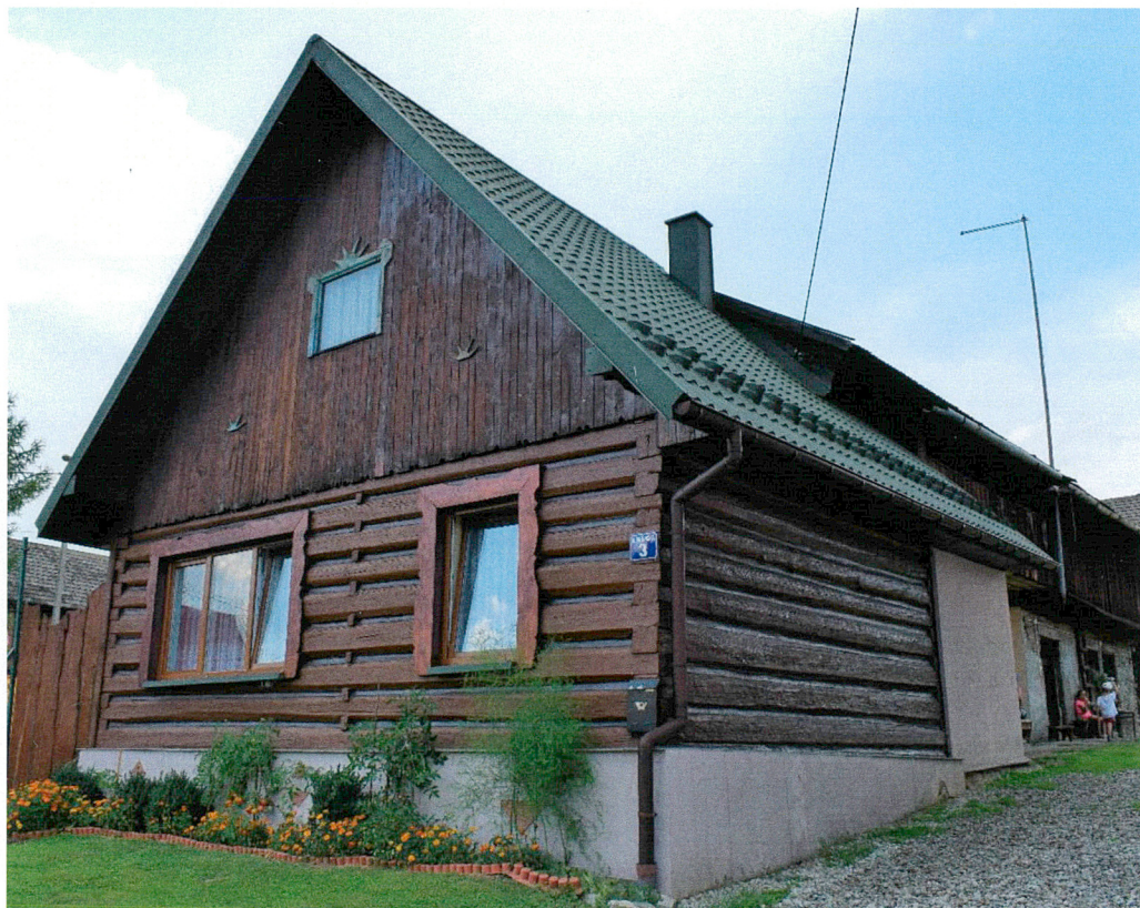
Widok od południowego wschodu