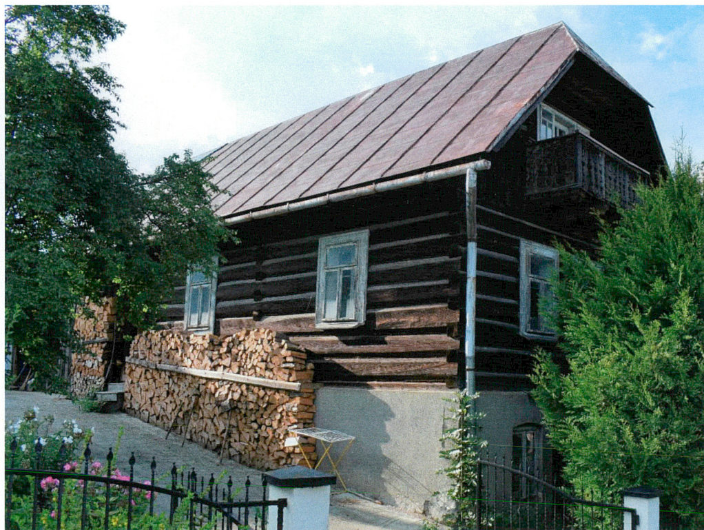
Widok od południowego wschodu