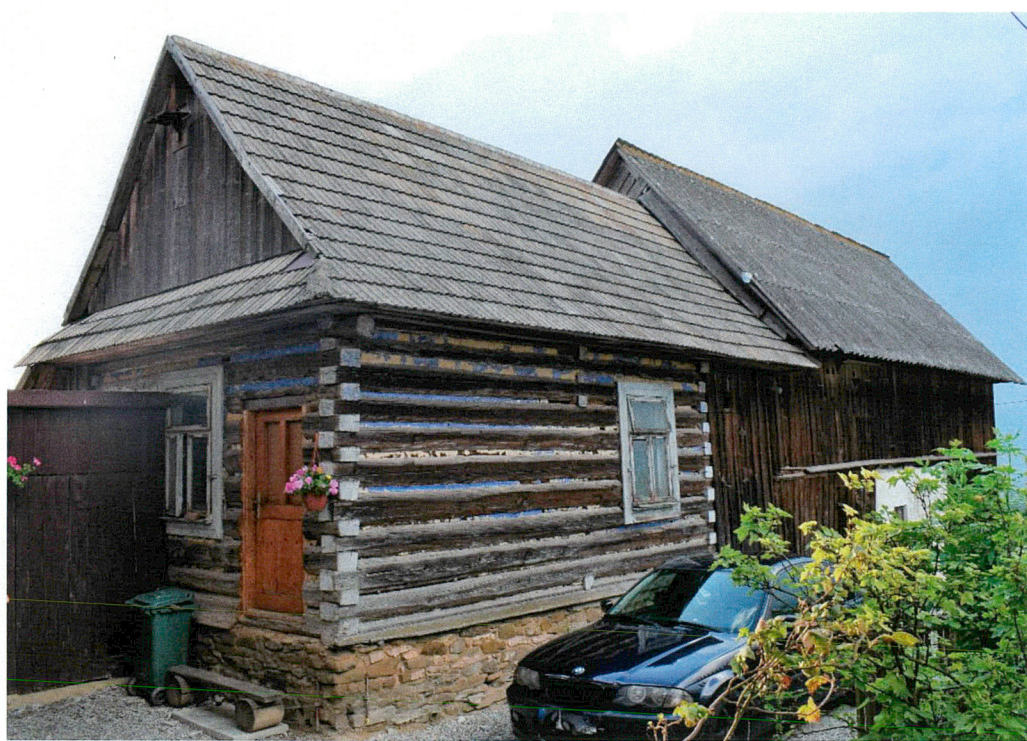
Widok od południowego wschodu