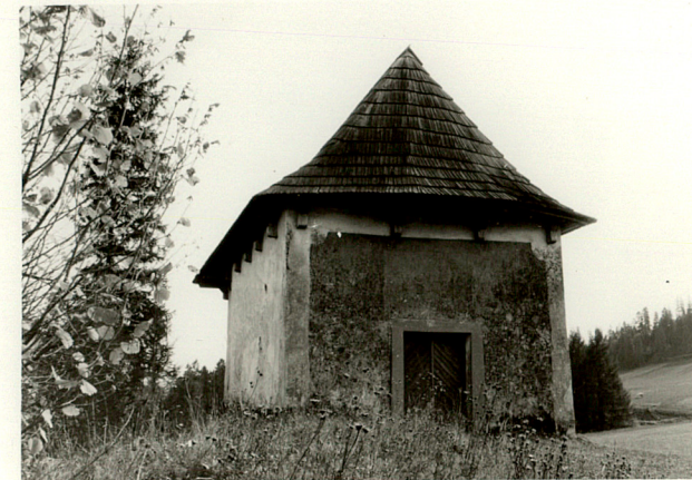
widok od zachodu