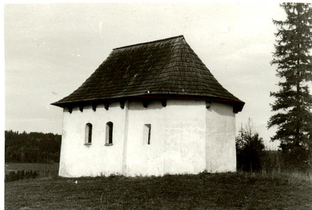
widok od południa