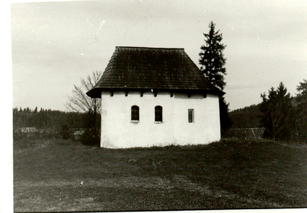
widok od północy

Wkładkę założył: mgr M.H. Grabski X 2000 r.