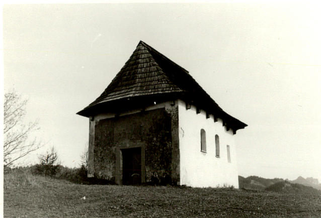
widok od zachodu