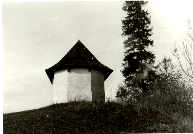
widok od wschodu