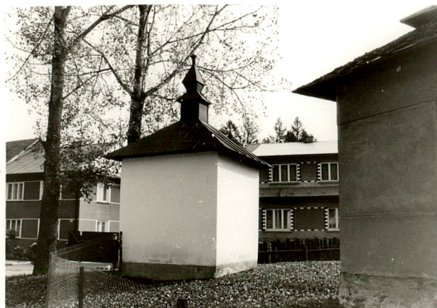
widok od zachodu