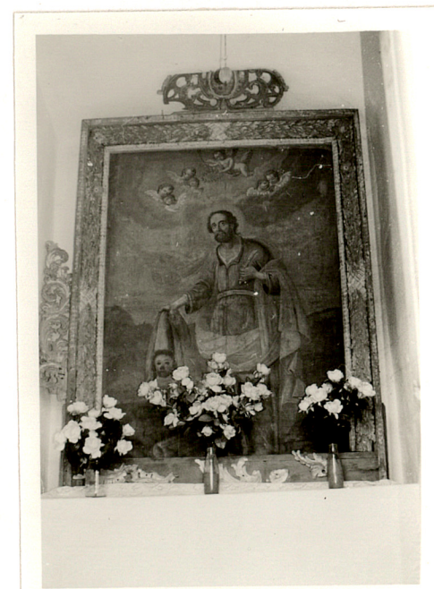
ołtarzyk z obrazem św. Bartłomieja