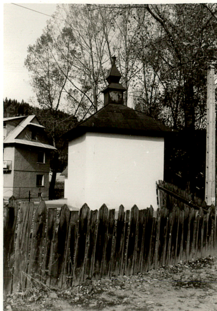
widok od wschodu