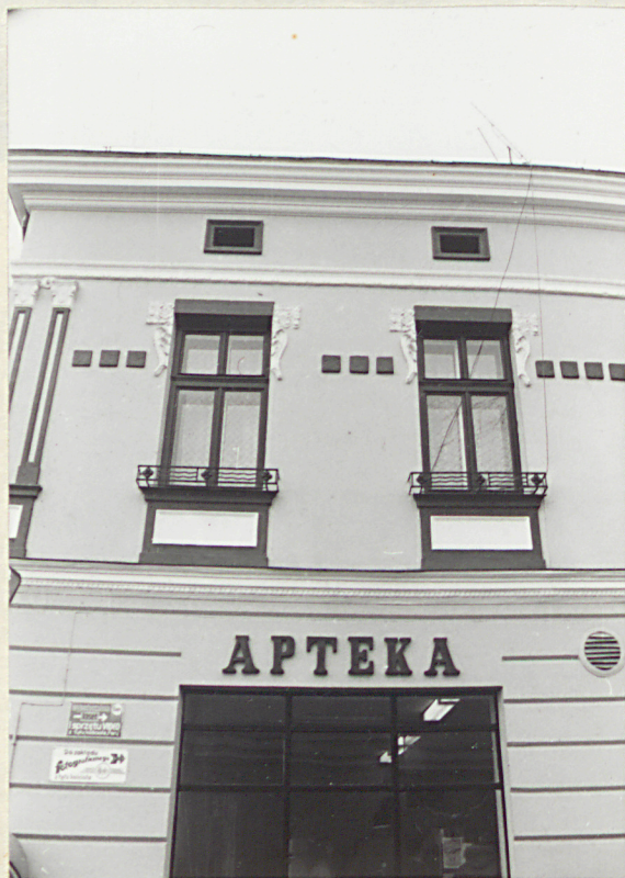
fragment elewacji frontowej