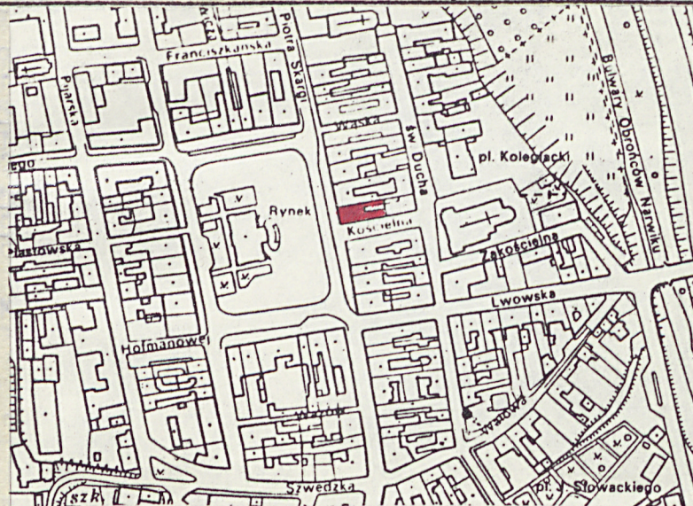
Budynek mieszkalny - Rynek 27