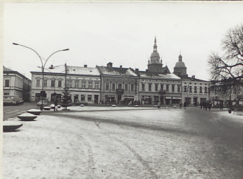
pierzeja wschodnia rynku

3. Zawartość wkładki (nazwa obiektu lub materiału uzupełniającego) c. d. opisu + fot. dodatkowe