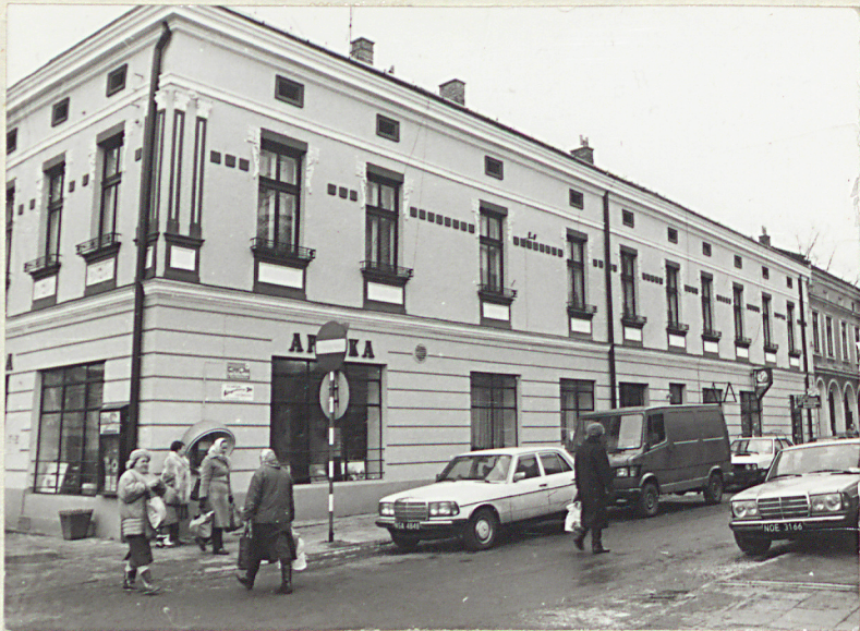
elewacja południowa / widok od zach./