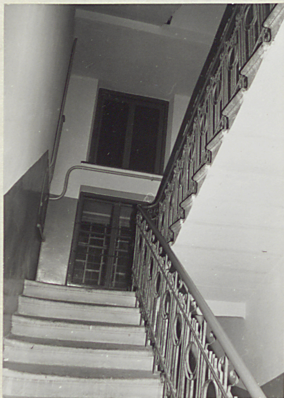
główna klatka schodowa