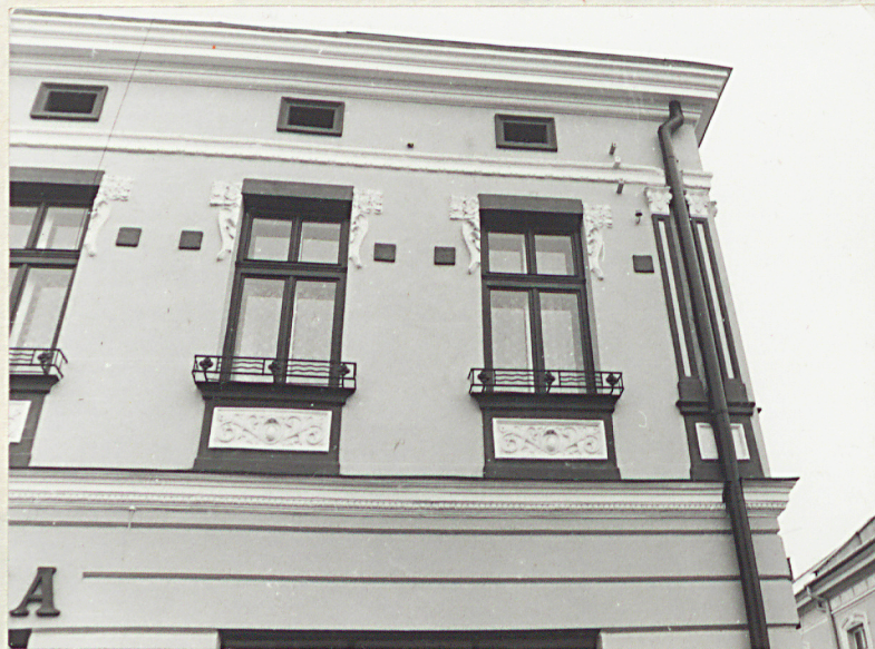
dekoracja architektoniczna piętra