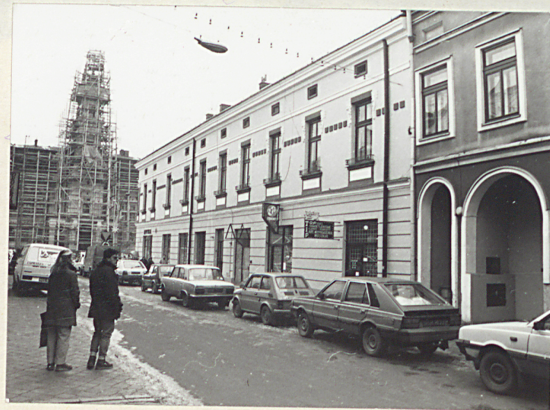
elewacja południowa / widok od wsch./