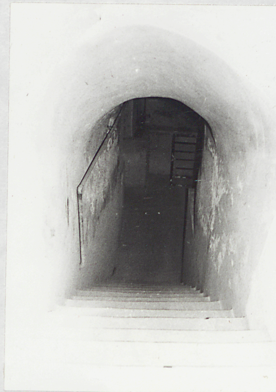
klatka schodowa do piwnic