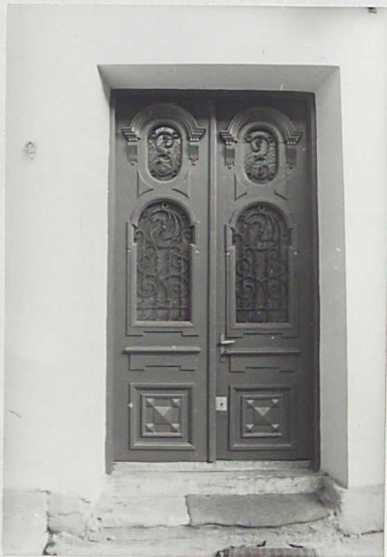
stolarka drzwiowa / elewacja tylna /