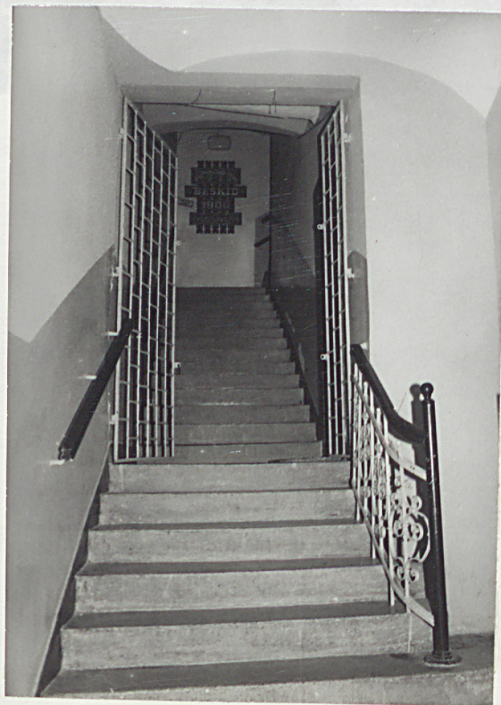
klatka schodowa na piętro