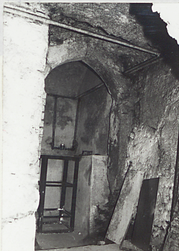
ostrołukowy portal kamienny z XV/XVI wieku w przejściu pomiędzy komorami piwnicznymi