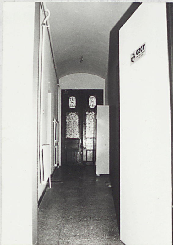
sień parteru w części tylnej