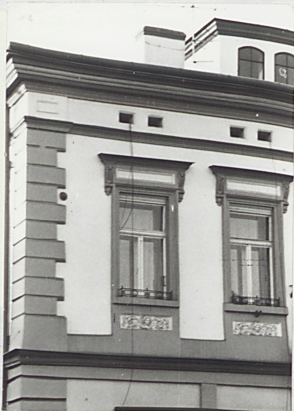
detal architektoniczny elewacji